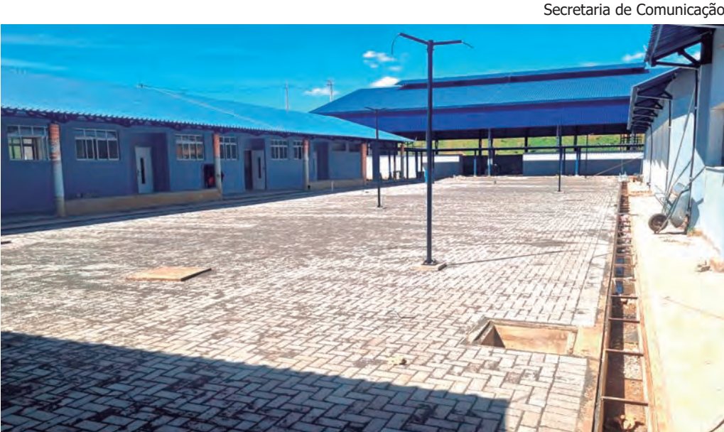
ÚLTIMOS DETALHES. A nova escola receberá 450 estudantes em período integral

documento com foto do aluno, documento com foto do responsável que vai assinar a matrícula, comprovante de endereço (se o responsável e o aluno não moram no mesmo endereço, é preciso apresentar comprovante de cada casa), declaração escolar da instituição em que o aluno estuda no ensino regular e uma foto 3×4 do aluno. A matrícula deve ser feita na Escola Municipal de Música na Avenida José Maurino, 80 (Centro). Para mais informações, ligue para (15) 3261-90 27 ou entre em contato pelo WhatsApp (15) 9.9746-61 42, no horários de 8h às 12h e 13 às 17h. As aulas começam no dia 3 de fevereiro.