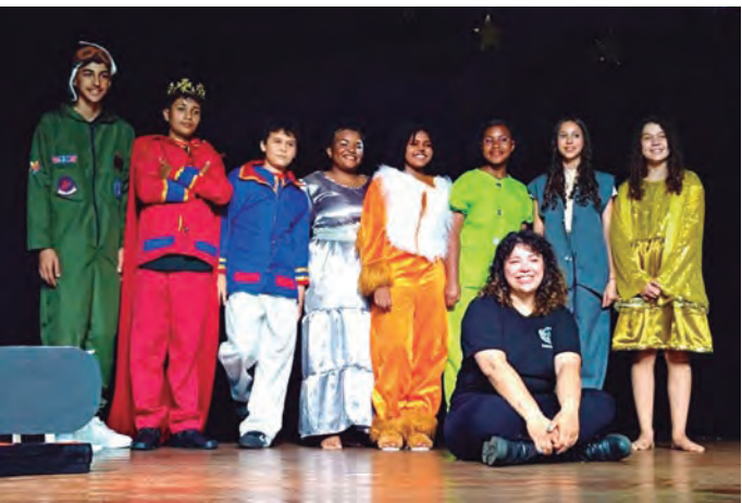
DEZ ESPETÁCULOS. A Jornada Teatral da Cia. Saindo do Conto apresentou clássicos com uma visão autoral

Durante o mês de dezembro, o grupo teatral Saindo do Conto promoveu sua Jornada Teatral, oferecendo ao público uma programação cultural intensa e diversificada. Ao todo, foram realizadas dez apresentações, reunindo famílias, estudantes e amantes do teatro na Estação das Artes Dona Assumpta Luzia Marchesoni Rogado. A jornada apresentou cinco espetáculos do repertório do grupo: “A Bruxinha que Era Boa”, “O Pequeno Príncipe: A Viagem do Coração”, “O Rapto da Emília”, “Trevo da Sorte: O Musical” e “Raptando o Papai Noel”. As montagens encantaram o público ao unir clássicos da dramaturgia com produções autorais, reafirmando o teatro como espaço de imaginação, sensibilidade e formação