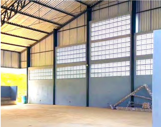
FASE FINAL. A escola receberá cerca de 450 alunos