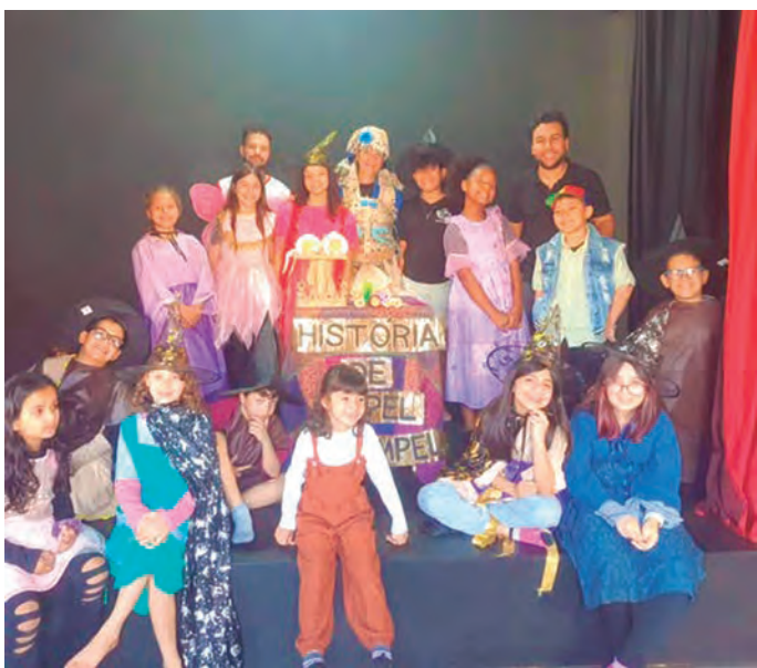
BENEFÍCIOS. Para as crianças, o teatro estimula a criatividade, desenvolve a capacidade de expressão, melhora a dicção e desenvolve habilidades de linguagem, além de reforçar a confiança e autoestima

TV e cinema. E no dia 28 de fevereiro a companhia fará uma audição para selecionar o elenco para o espetáculo teatral “Monção”, inspirado na história de