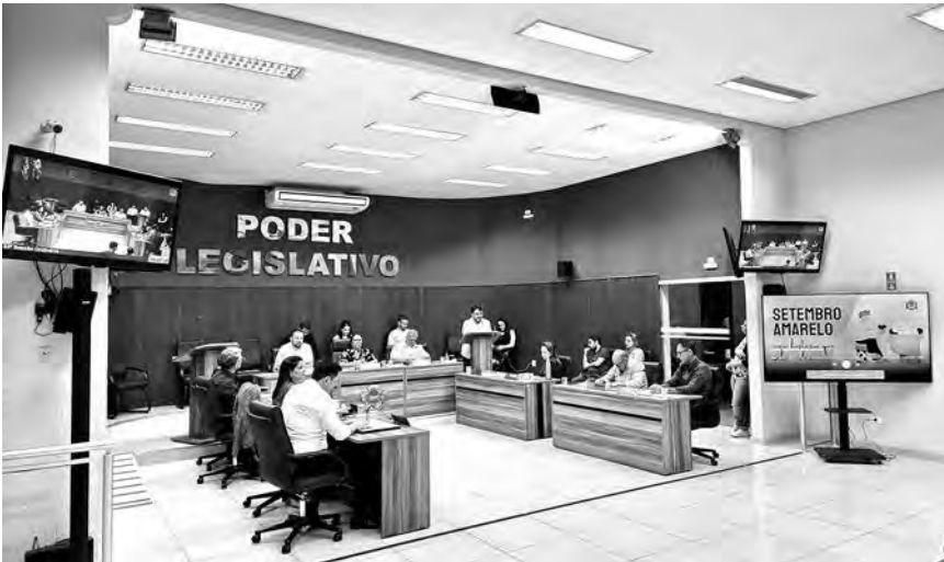
CONSCIENTIZAÇÃO. Os vereadores, ao longo do ano, incluíram no Calendário Oficial do Município campanhas como o Setembro Amarelo, que mobiliza a comunidade na prevenção de suicídios