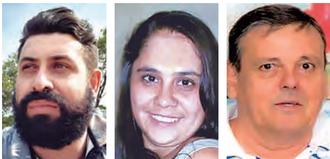
Na segunda-feira 5 aniversaria Everton Na quarta-feira 7 aniversaria Tânia Na quarta-feira 7 aniversaria Valdemar