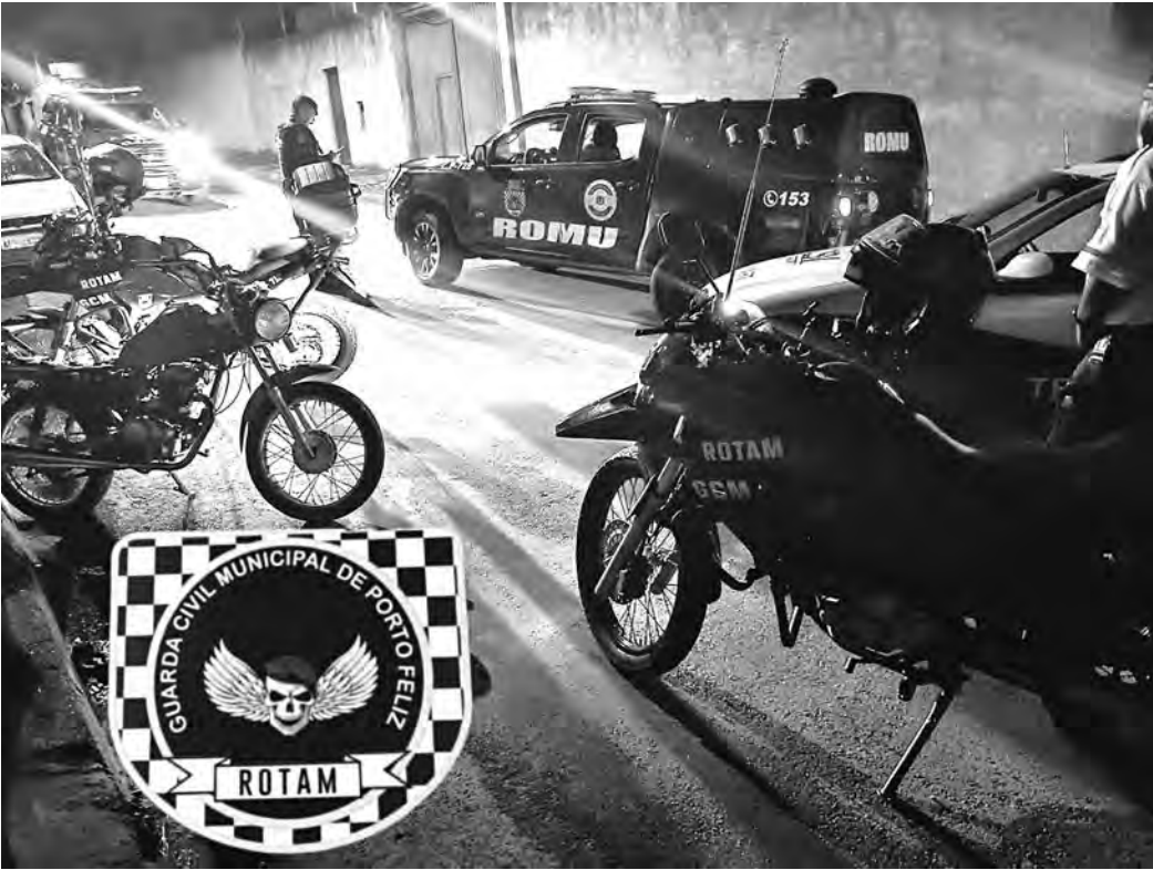
FISCALIZAÇÃO. Na quinta-feira 1º a GCM fez bloqueios em duas avenidas

A Guarda Civil Municipal e a Diretoria de Sistema Viário (DSV) começaram o ano realizando operações em duas avenidas da cidade. As operações ocorreram nesta quinta-feira 1º. Na Dr. Antônio Pires de Almeida, dois pilotos tentaram fugir quando se depararam com o ponto de bloqueio da GCM e DSV. Os agentes sinalizaram para que os pilotos