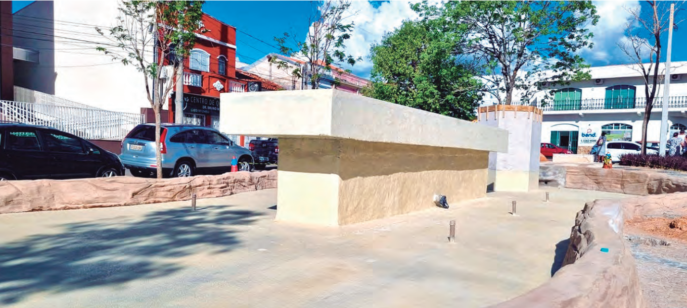
PEDESTAL. No centro da praça, a estrutura que receberá a escultura monumental está pronta