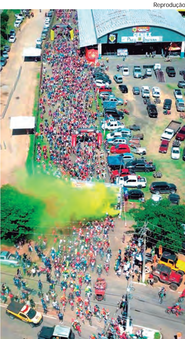
LARGADA NO DOMINGO. Evento agitou a cidade e trouxe visitantes de várias partes do Estado e do País

Mais de 1.000 motos, pilotos de 120 cidades e um trajeto de tirar o fôlego. Este foi o 15º Trilhão das Monções — o maior trilhão do Estado de São Paulo.