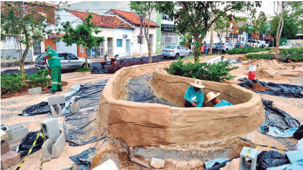
MUITO TRABALHO. Os serviços avançaram nesta semana com o plantio de flores e a conclusão do tanque que simbolizará o velho Anhembi — o Rio Tietê

tural dessa revitalização será a instalação de uma nova escultura monumental do renomado artista plástico Murilo Sá Toledo. O custeio dessa obra será feito integralmente pela JHSF. Murilo Sá é conhecido por suas obras de temática histórica em bronze e cerâmica, como o Monumento aos Bandeirantes em Santana de Parnaíba e o Apóstolo Paulo na Praça da Sé, em São Paulo.