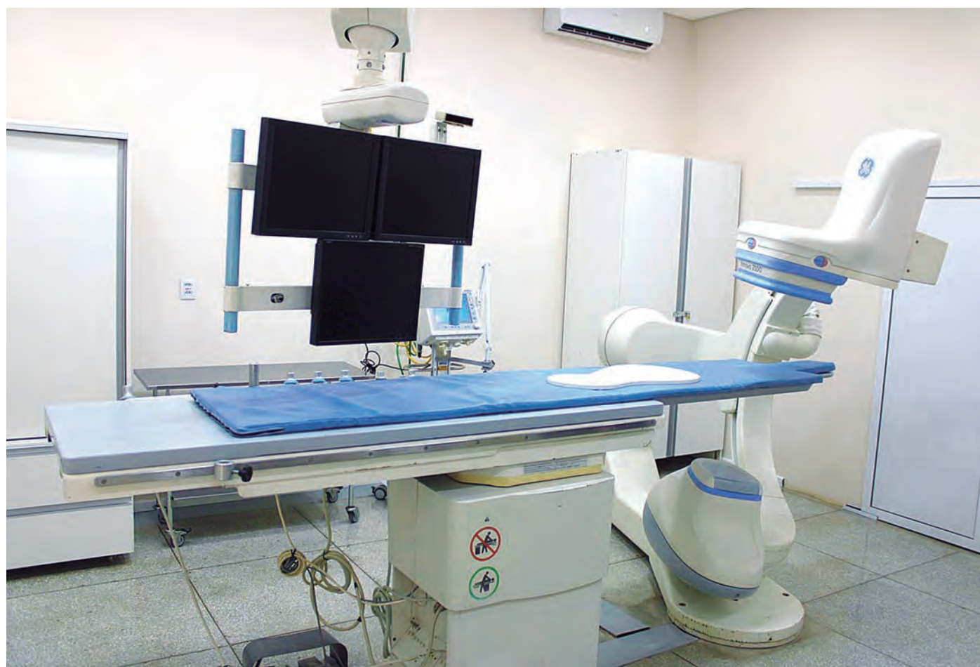
CENTRO DE HEMODINÂMICA. Com equipamentos modernos, ele tem por modelo um serviço de alta excelência