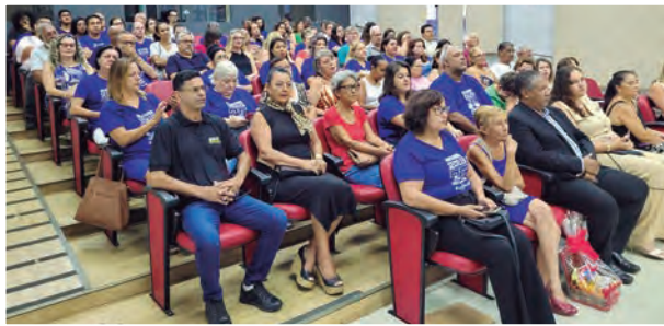
MOMENTOS DE EMOÇÃO. A homenagem às antigas mestras foi um dos pontos altos da Sessão Solene, que lotou o auditório da Câmara