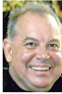
Na terça-feira 25 aniversaria Didi