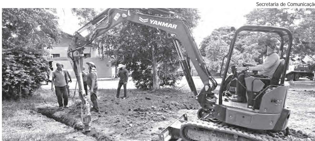
MAIS LAZER NO BEPIM. Nesta semana a Secretaria de Serviços Públicos iniciou a construção de uma quadra esportiva na Praça Alvíse Mieto (Residencial Bepim). Com a quadra, novos bancos e iluminação com lâmpadas de LED, a praça vai oferecer melhores condições de lazer e atividades esportivas para os moradores do bairro e região.