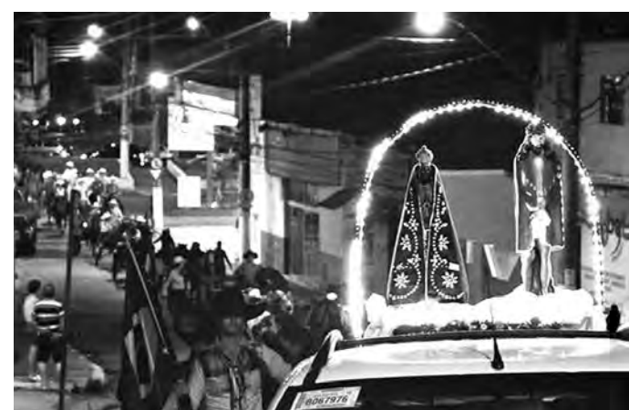
HÁ SEIS ANOS. Romeiros desfilam após a viagem