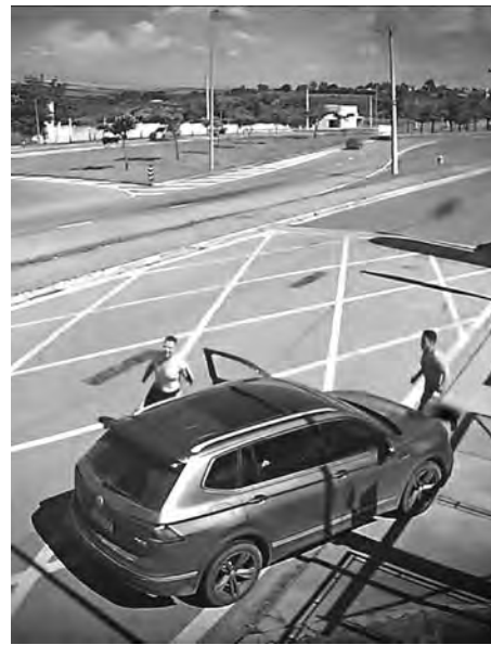
2 Um bombeiro sai correndo e acompanha o motorista até a traseira do veículo