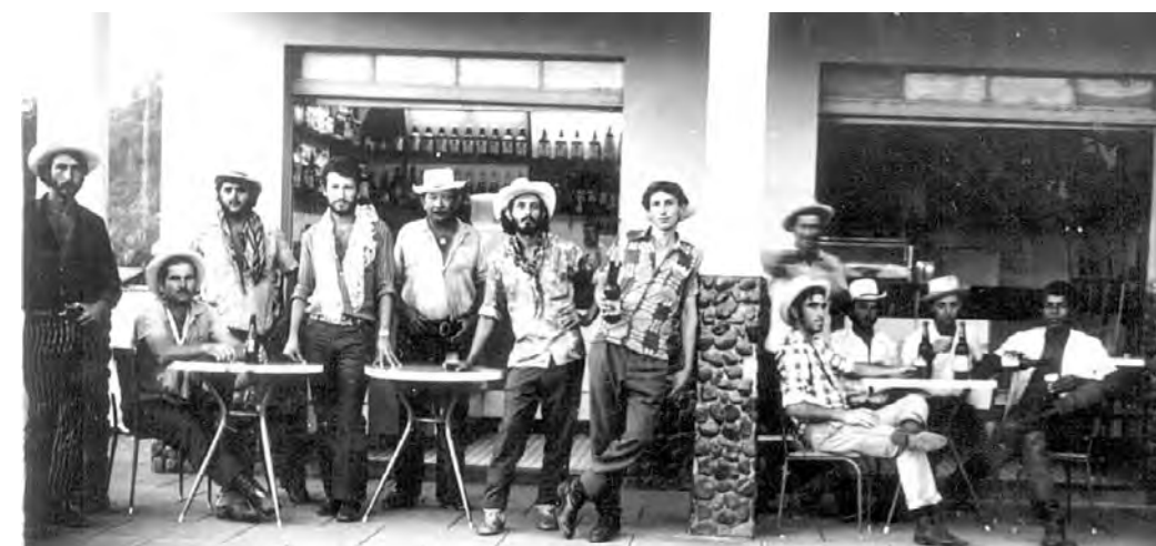
PAUSA. Em foto de data desconhecida, romeiros num momento de descontração