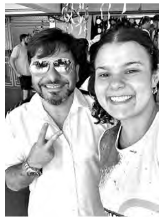
ALALAÔ! A Banda Bandeirantes apresentou seu repertório carnavalesco