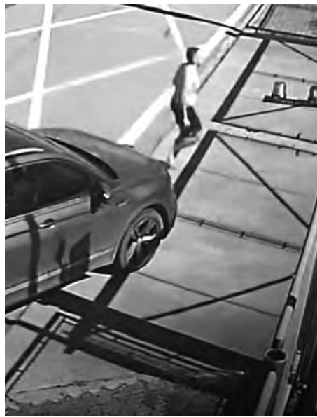
1 O SUV para em frente à Base de Bombeiros e o motorista desce correndo e pede socorro

Dentro desse panorama, Porto Feliz consolida-se como uma das cidades mais seguras da região, acompanhando a tendência estadual de queda nos crimes contra a vida e apresentando desempenho ainda mais expressivo que a média paulista.