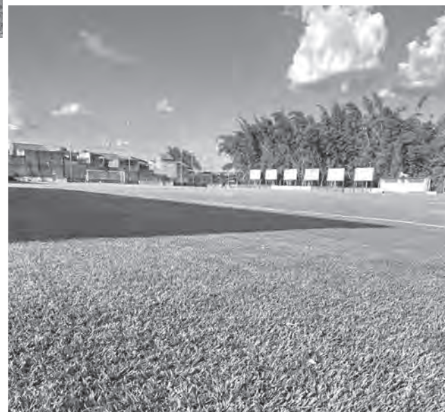
NO CARNAVAL No alto, o Ararita Máster; à esq., o Cinquentão; acima, o gramado do Estádio dos Bambuais, que abriu seus portões depois de serviços de manutenção

Nenê Lanches. O Leão anotou mais uma vitória, 2 x 1. Os gols foram de Cazu e Felipe.