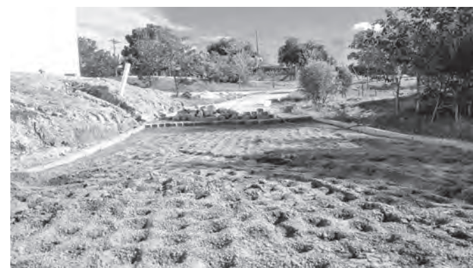
NIVELAMENTO. O solo foi preparado para o assentamento de mais um trecho de pisos intertravados