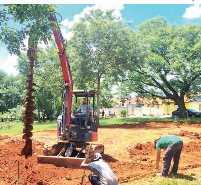
Secretaria de Comunicação

EM OBRAS. A Prefeitura deu início à construção de uma quadra esportiva na praça do Residencial Bempim | Página 4