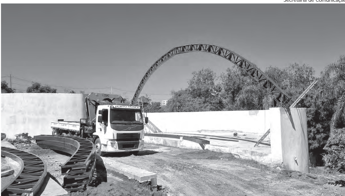
COBERTURA. As estruturas metálicas da Concha Acústica e a cobertura começaram a ser montadas

A construção do Parque Municipal não tem qualquer custo à cidade. O projeto foi doado por Molina e as obras são realizadas pela JHSF.