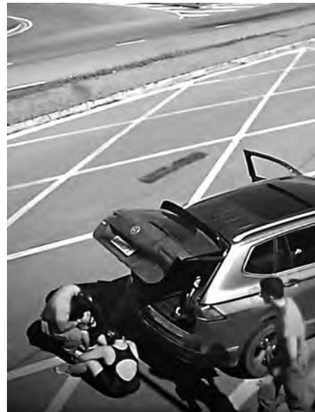
5 Outro bombeiro chega para ajudar o colega; o pai não se contém de nervosismo e afasta-se da cena