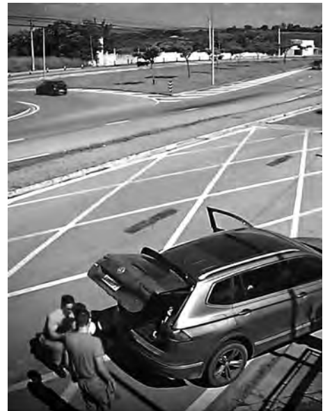
6 Final feliz: com as manobras de emergência, a criança volta a respirar e volta para o colo da mãe