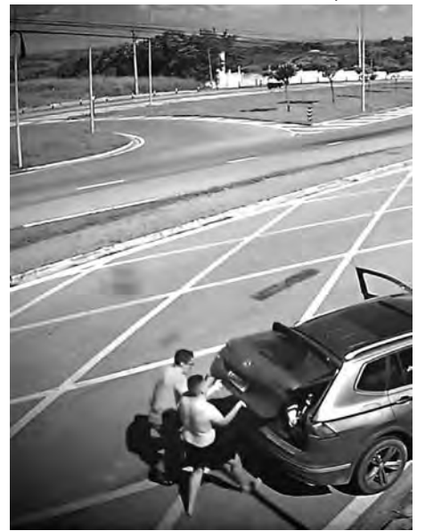
3 Os dois abrem rapidamente o porta-malas do SUV, onde estava a mãe e a criança