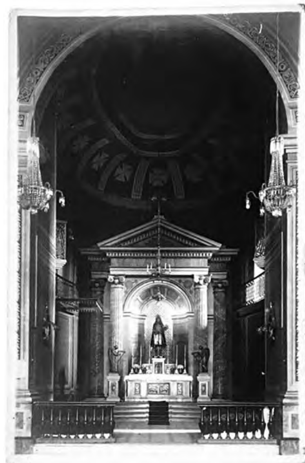
LEMBRANÇA. Cartão Postal do Santuário de Pirapora