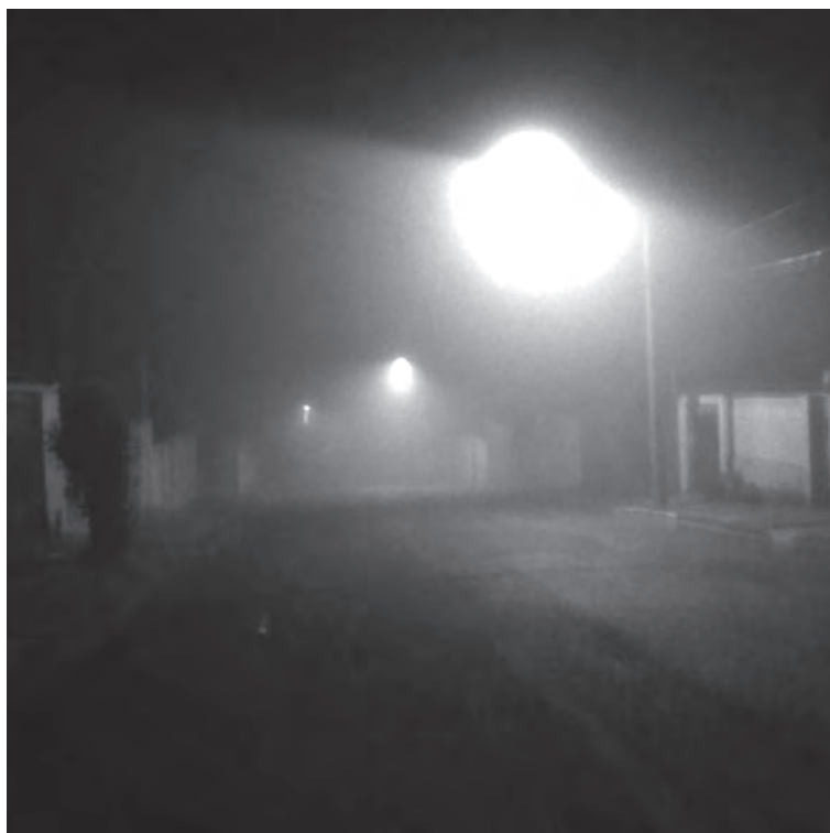
BARRA FUNDA. A bela foto de Paulo Henrique Baldini capta a magia e o mistério do bairro mais poético de Porto Feliz

O primoroso registro do fotógrafo Paulo Henrique Baldini nos remete ao sublime encanto das madrugadas antigas e geladas da velha Terra de Ararituaguaba, no tempo em que nossos músicos e cantores promoviam vibrantes serestas, principalmente pelos recantos da Barra Funda, o bairro poético de Porto Feliz!