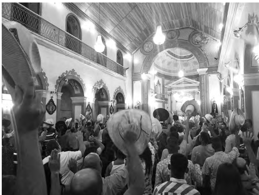
EM 2017. Romeiros de Porto Feliz no Santuário do Senhor Bom Jesus

Os arquivos da TRIBUNA tem numerosas fotos atestando a antiguidade das romarias de fervorosos porto-felicenses a Pirapora do Bom Jesus.