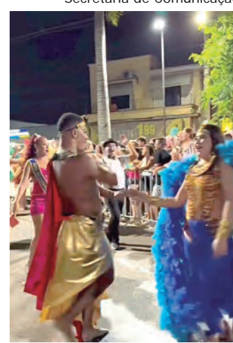
Secretaria de Comunicação

A programação agradeceu e o tempo colaborou, fazendo com que muita gente saísse às ruas para viver dias de muita alegria, música e tradição. O Carnaval 2026 foi um sucesso. A criançada se divertiu nas matinês promovidas pela Secretaria de Cultura, Esportes e Turismo da Prefeitura no Avenida Shopping. À noite, além dos shows na Praça Dr. José Sacramento e Silva (Praça da Matriz), as tradicionais escolas de samba Monções e Barra Funda deslumbraram o público. E não faltaram blocos, para a alegria dos foliões: CR2, Batelão, Carnarinho, Banda Angélica e Tratorzinho. Foi uma grande festa, que você revive nas fotos desta edição | Página 12