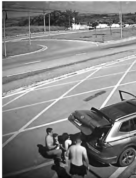
4 O bombeiro pega no colo o menino de dois anos; os pais estão desesperados