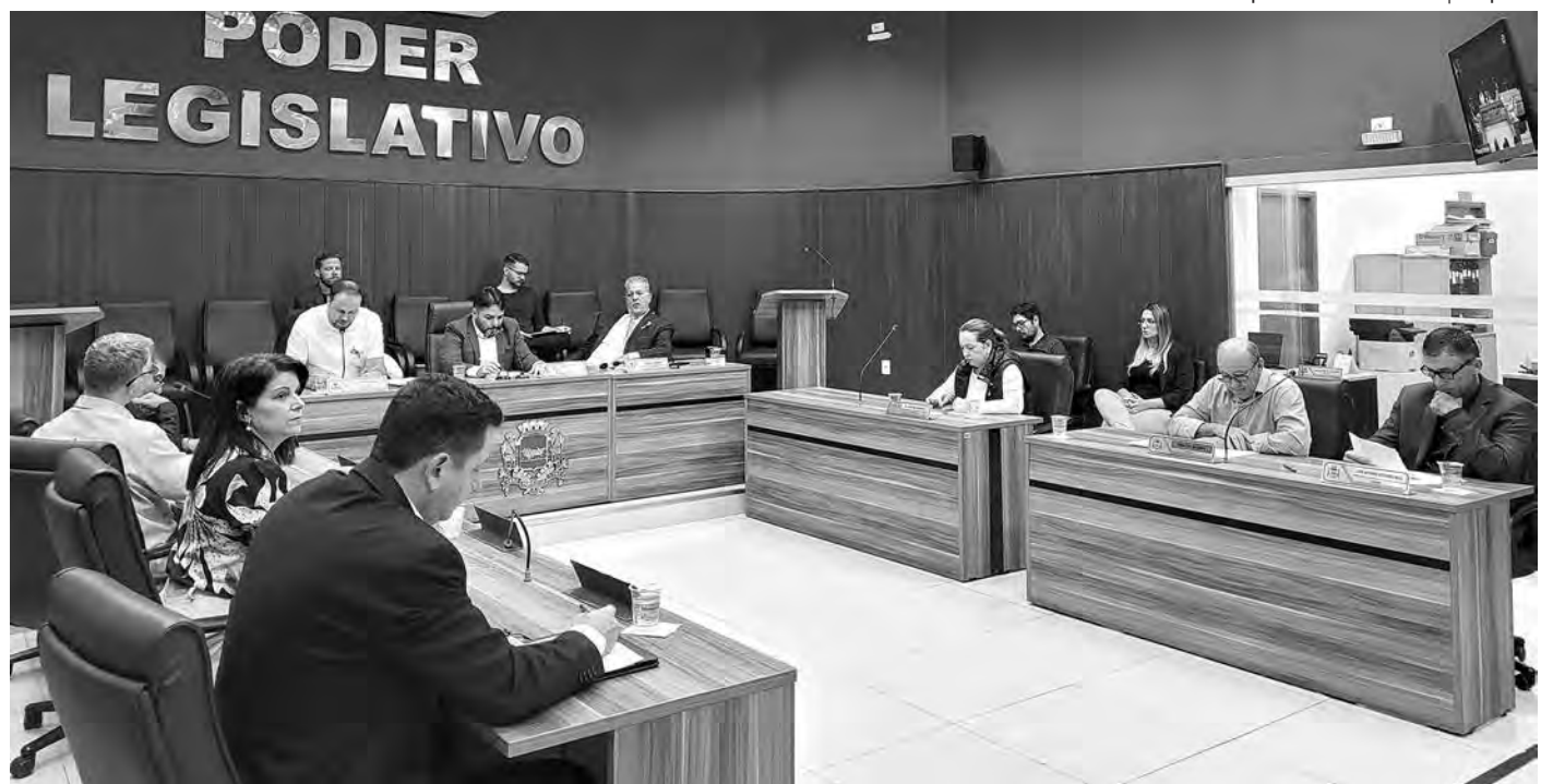
ÚNICO DA PAUTA. A expectativa é de que o projeto será aprovado sem polêmicas na sessão da próxima semana

Com a aprovação do projeto e sua implantação, um veículo exclusivo para Ronda Maria da Penha,