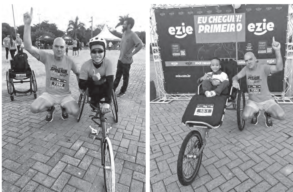
SPEED RUN. A prova contou com a participação de muitos cadeirantes

lazer e confraternização com familiares e amigos.