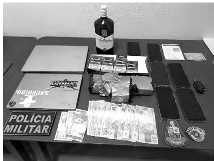
JARDIM JANDIRA ALCALÁ. O tijolo de maconha e o dinheiro estavam escondido num carro