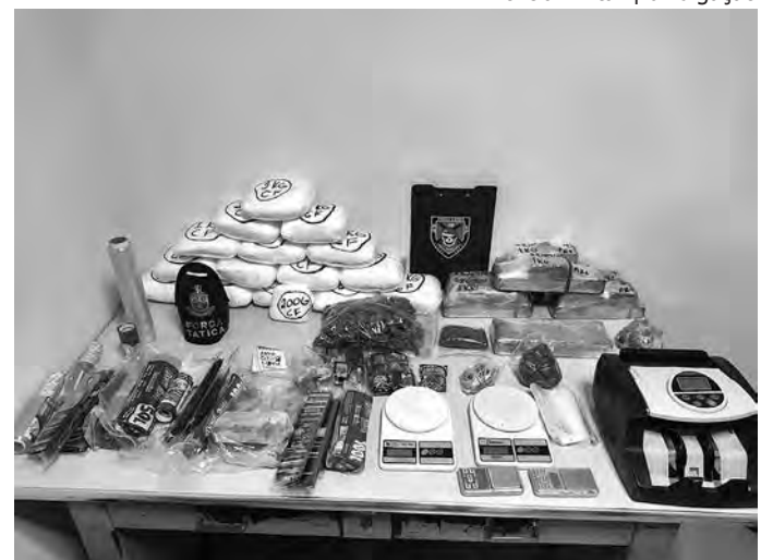
JARDIM VANTE. A casa funcionava como uma verdadeira 'linha de produção' de porções