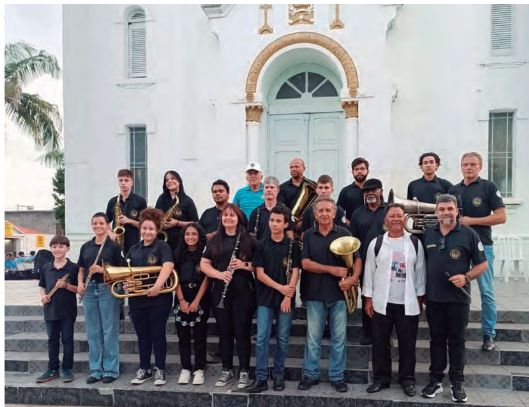
AGENDA CHEIA. A banda já tem vários compromissos depois de Bofete

A Banda Bandeirantes apresentou músicas do seu repertório e foi muito