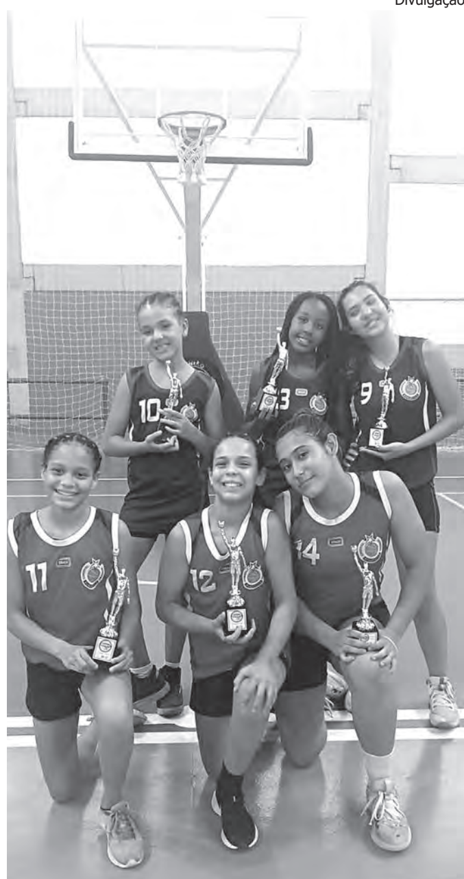
CAMPEÃS. Comemorando os resultados em Tietê