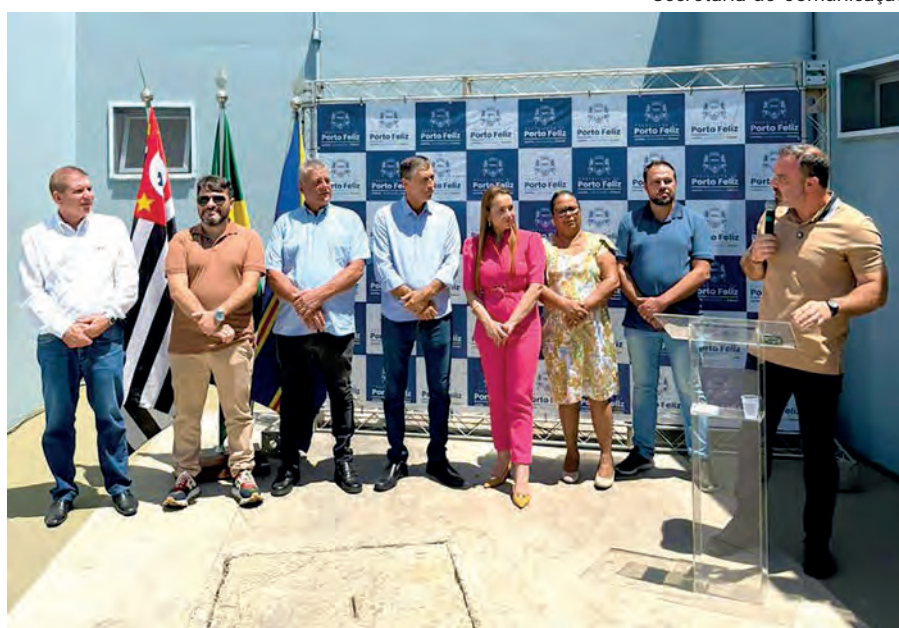
Secretaria de Comunicação

O prefeito Célio Peixoto atendeu, na manhã desta sexta-feira 28, uma importante reivindicação da cidade. Ele inaugurou a ala pediátrica do Pronto-Socorro Municipal. A nova ala vai atender exclusivamente crianças e adolescentes de até doze anos de idade. Diariamente, 24 horas por dia, estarão na nova ala três médicos pediatras, um enfermeiro, um atendente e um técnico de enfermagem. A nova ala recebeu o nome de Pronto Atendimento Infantil (PAI). Ela tem entrada independente e ambientes especialmente projetados para receber crianças e jovens. “Um espaço exclusivo e especializado, com entrada e atendimento separados para as urgências e emergências das nossas crianças e jovens. Cuidar do futuro é nossa prioridade!”, disse o prefeito. Célio também anunciou a instalação de um laboratório no Pronto-Socorro Maria de Lourdes Assunção Oliveira, para agilizar a realização dos exames.