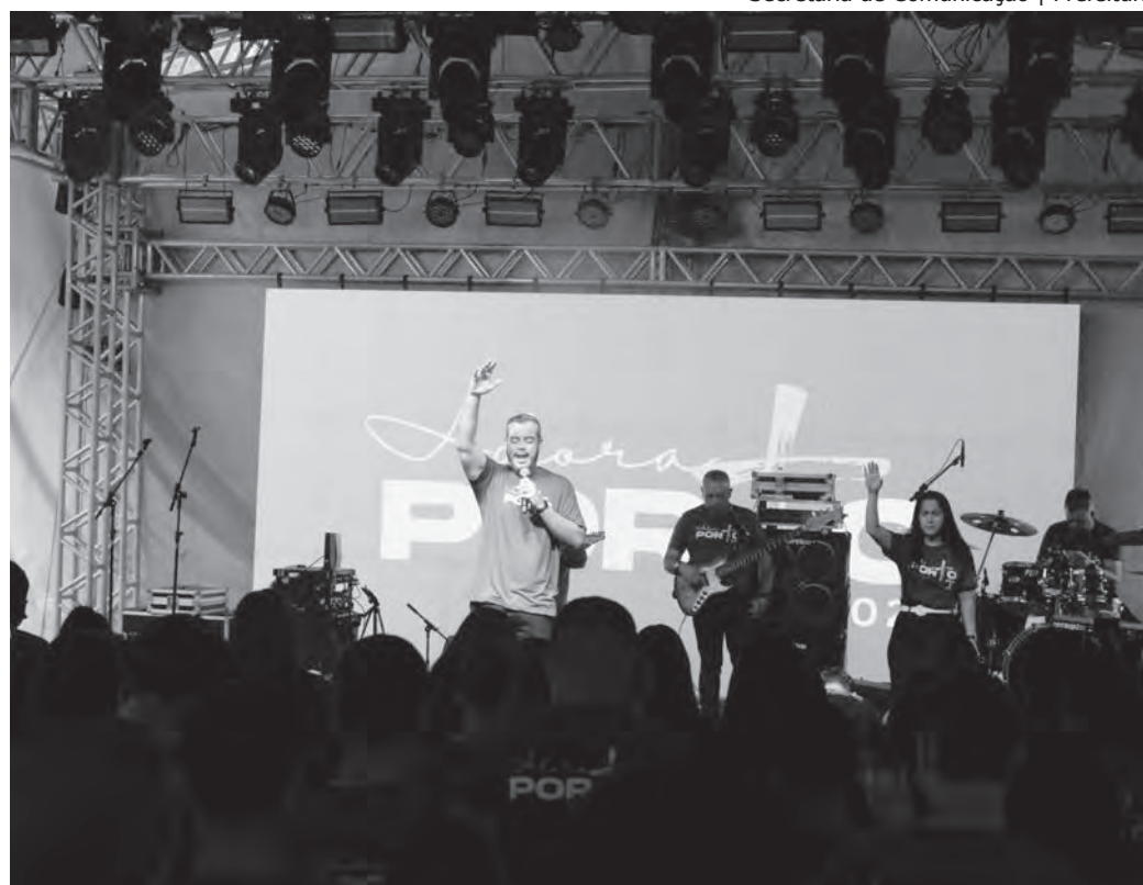
1ª EDIÇÃO. Evento realizado em novembro reuniu centenas de pessoas

Posteriormente, a Lei nº 5.435/2015 deu nova redação ao Art. 1º da lei anterior, alterando o nome