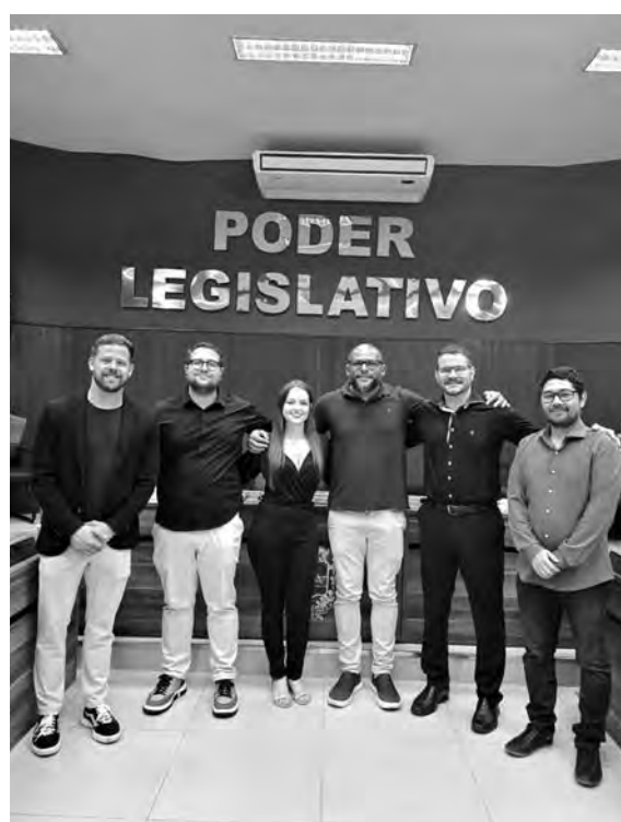
CONVITE. A iniciativa da palestra foi da ELEP