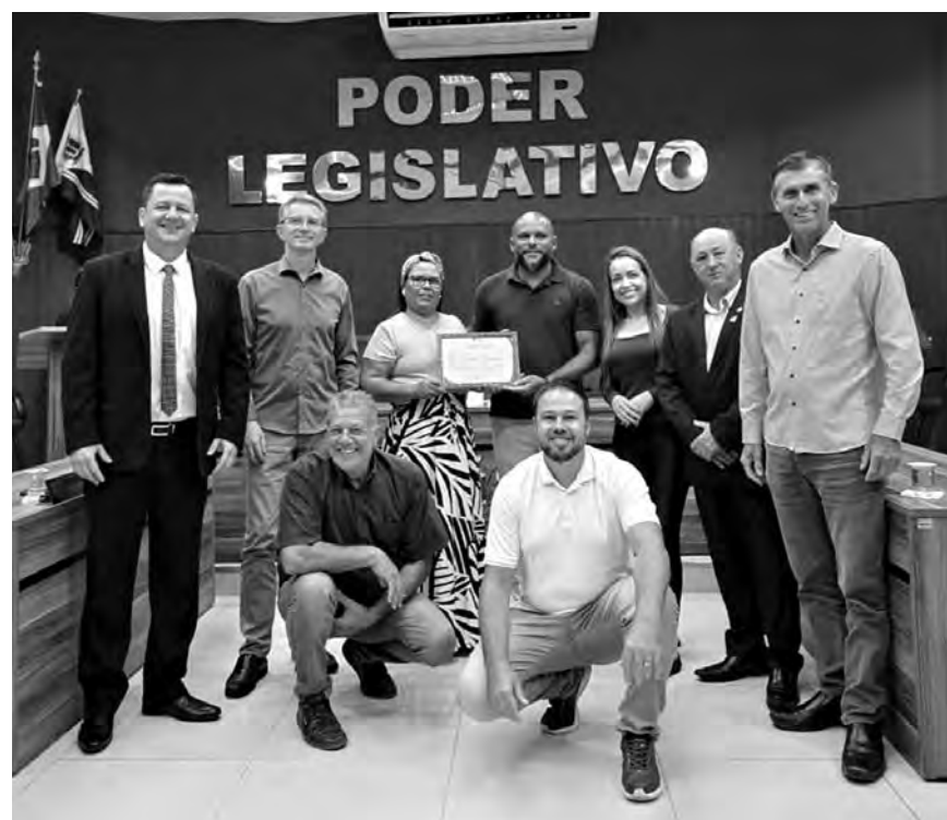
HOMENAGEM. A Câmara reconheceu a notável trajetória do palestrante