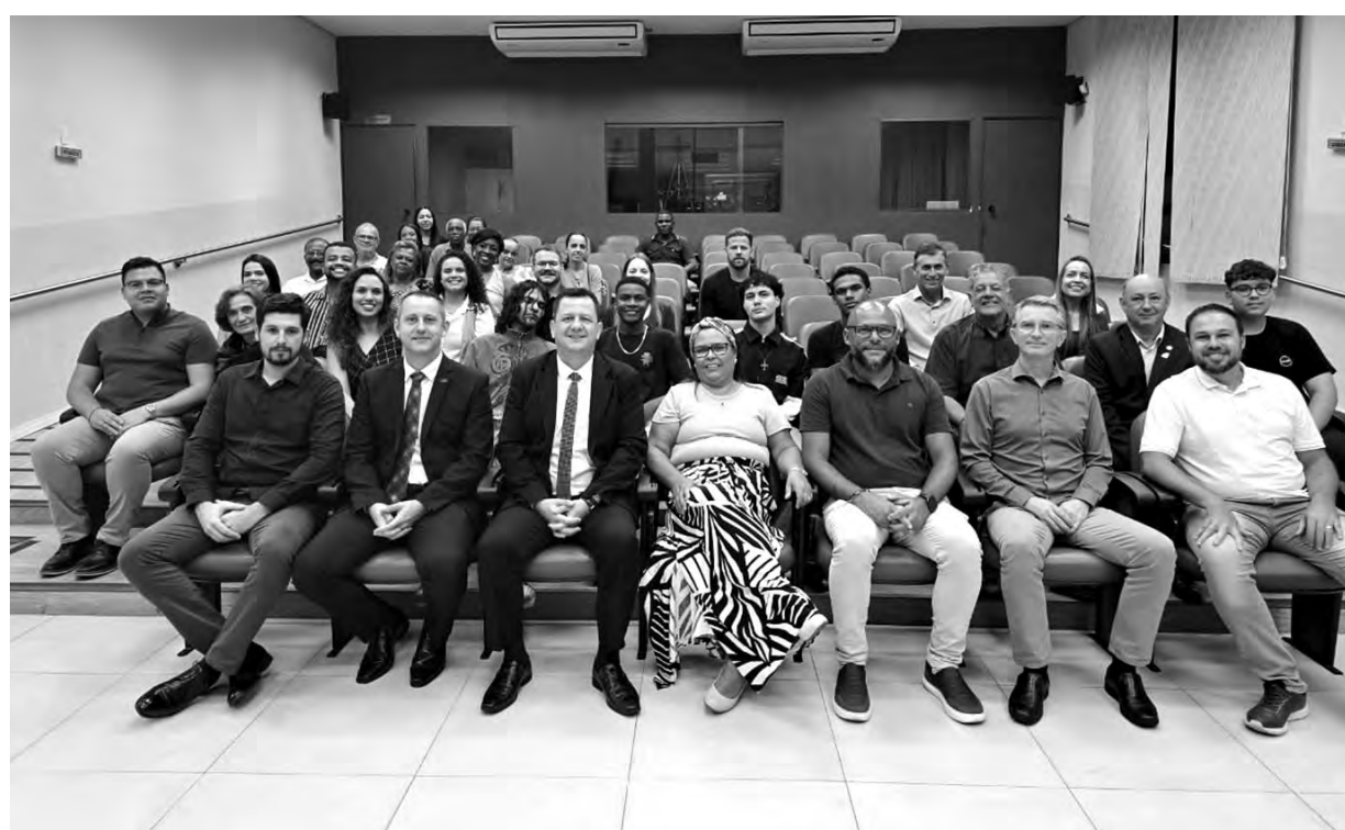
ZUMBI DOS PALMARES. A Sessão Solene marcou o Dia da Consciência Negra, ponto de partida e não de chegada para o debate da questão racial

O palestrante iniciou sua fala destacando que o 20 de novembro, data em memória de Zumbi dos Palmares, não deve ser um “ponto de chegada, mas sim um ponto de partida” para a discussão.