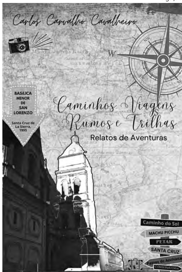
CAPA DO LIVRO. Muitas histórias