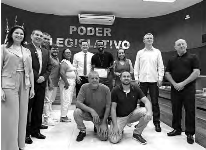
HOMENAGEM NA CÂMARA. Com os vereadores (à esq.) e com a família, exibindo a Moção de Aplausos