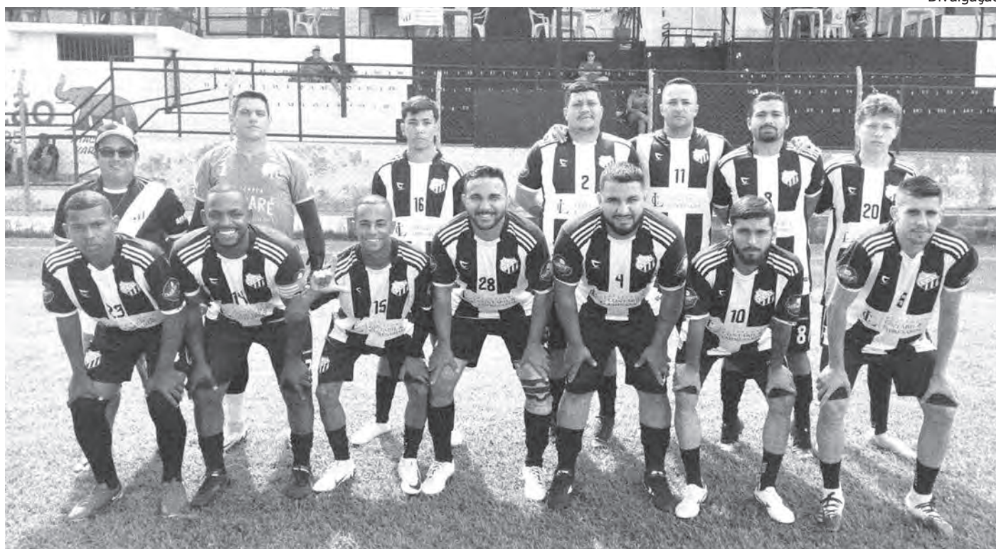
EXPRESSO ARARITA. A equipe enfrentou o Grêmio Esportivo Popular e conseguiu virar o jogo no último sábado

No domingo (23), o Estádio dos Bambuais, os Veteranos Cinquentões do Ararita receberam a