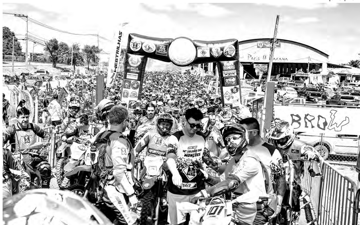
Arquivo | 2024

No Trilhão, a solidariedade sempre chega em primeiro lugar. Com