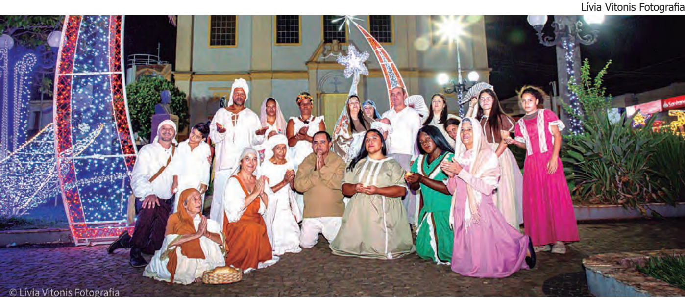
Lívia Vitonis Fotografia