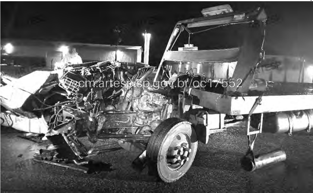
CABINE DESTROÇADA. O motorista do caminhão-guincho morreu preso às ferragens

Na Rondon, encarregado é atropelado; na Castello, caminhoneiro morre ao bater contra traseira de semirreboque