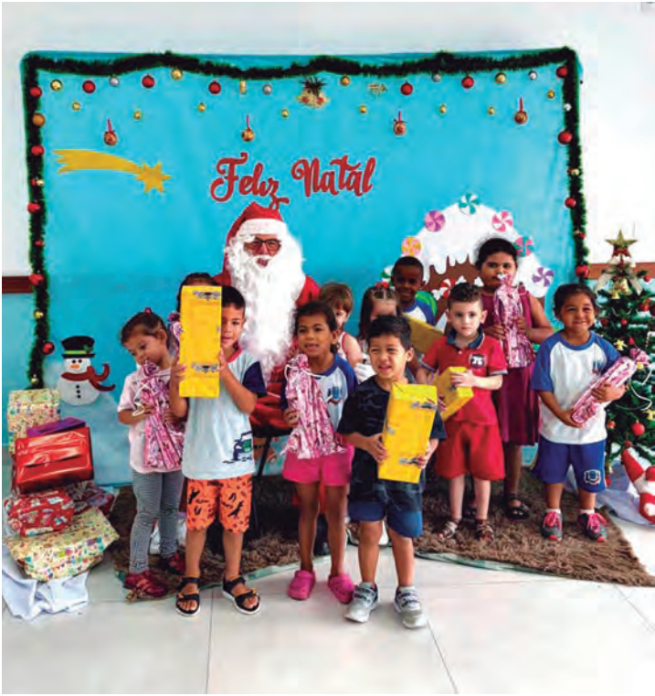
Creche Lenita Habice Prado