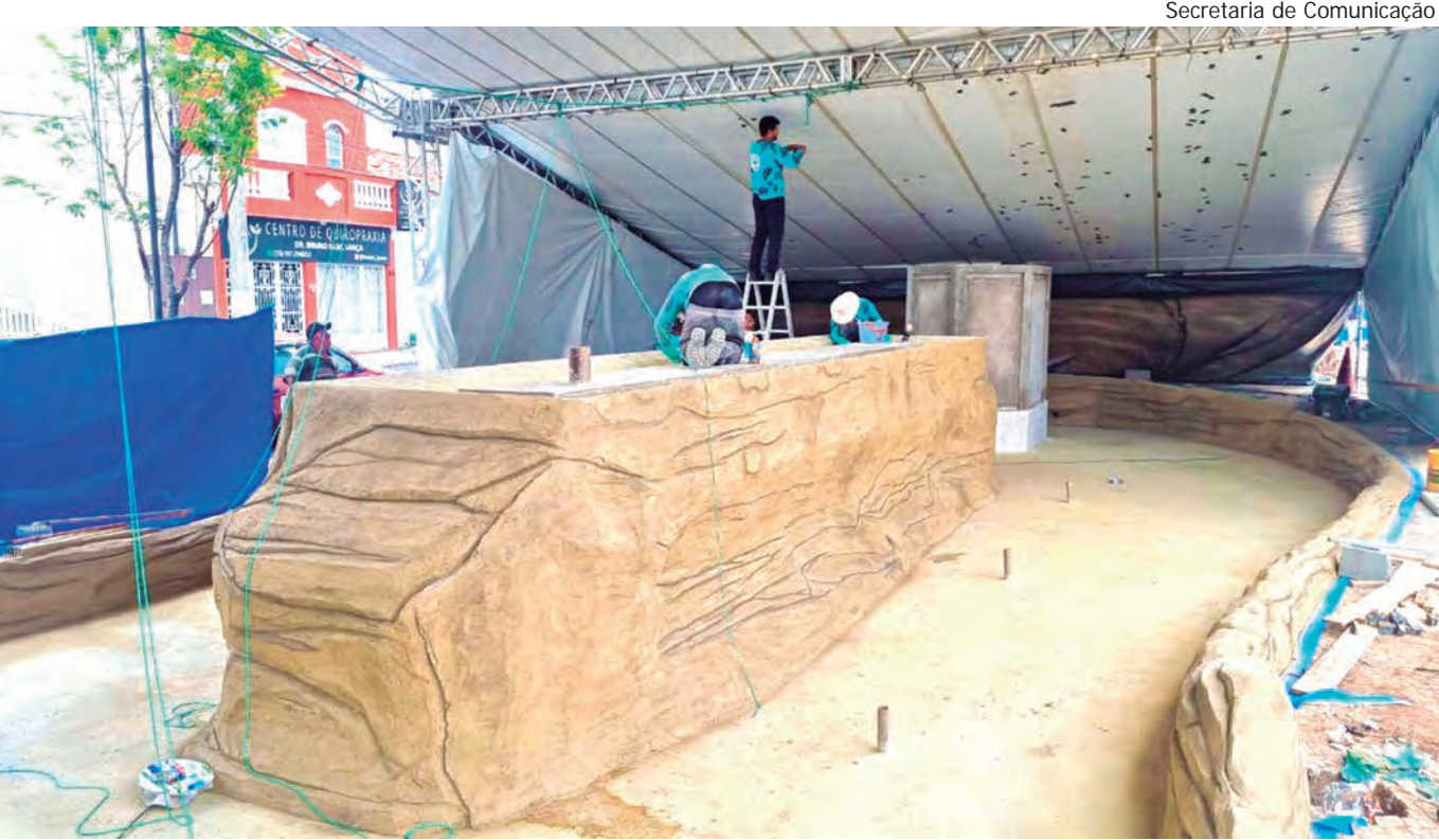
Secretaria de Comunicação

O QUE SERÁ ISSO? As pessoas que passam pela Praça Duque de Caxias/Largo da Penha, por mais apressadas que estejam, não resistem a parar e examinar as obras. Há grande curiosidade em saber o que são aquelas estruturas todas e como a praça ficará depois da completa reformulação. As equipes estão se apressando para entregar a obra. A Prefeitura promete entregar a nova Praça Duque de Caxias/Largo da Penha ainda neste mês