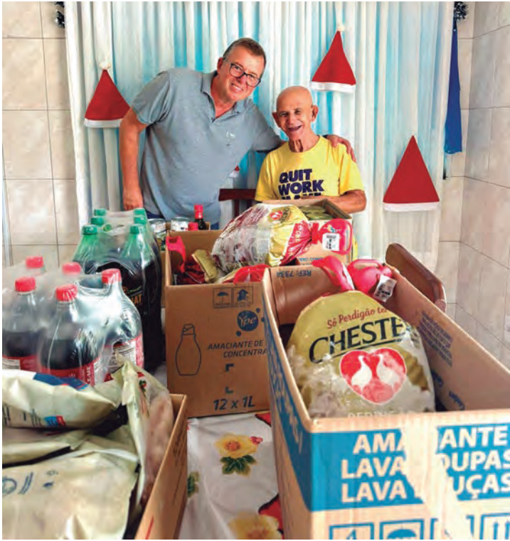
Cidade dos Velhinhos