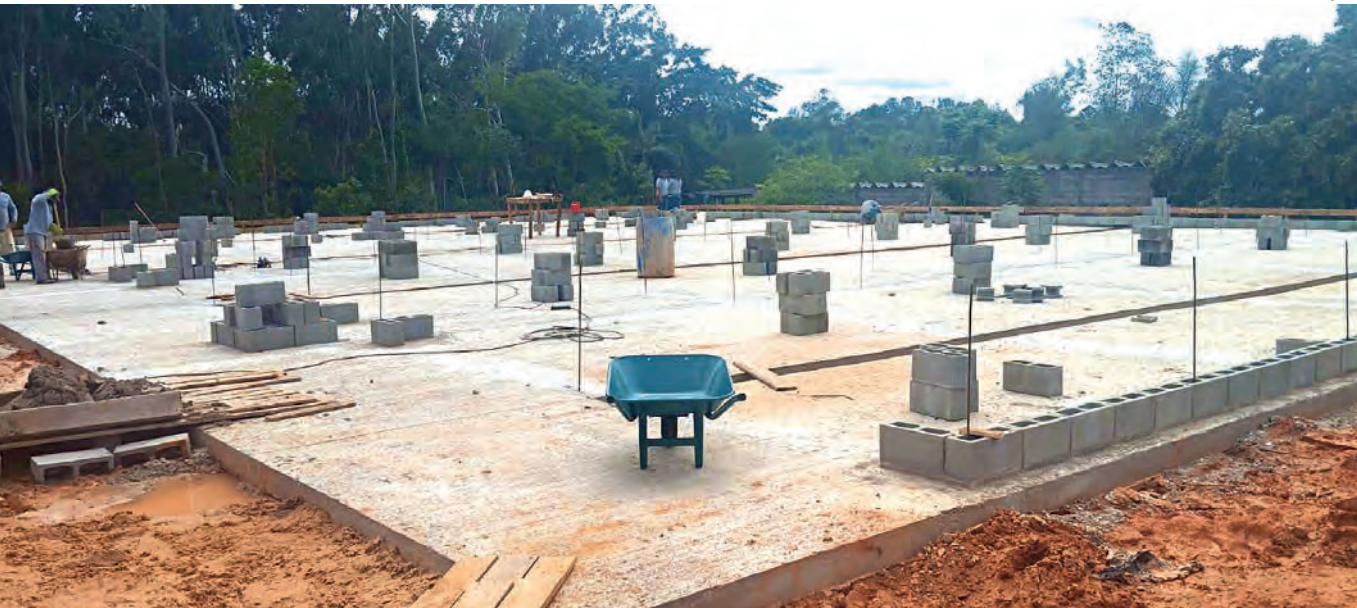
NOVO CANIL. Estão assim as obras no Canil Municipal. A base para as futuras baias foi concretada e teve início a colocação das ferragens. Ao mesmo tempo, a Prefeitura já plantou a grama no entorno da obra