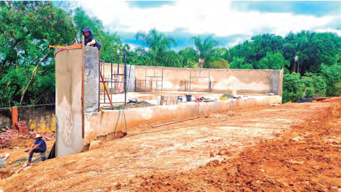
Secretaria de Comunicação

O QUE SERÁ ISSO? As pessoas que passam pela Praça Duque de Caxias/Largo da Penha, por mais apressadas que estejam, não resistem a parar e examinar as obras. Há grande curiosidade em saber o que são aquelas estruturas todas e como a praça ficará depois da completa reformulação. As equipes estão se apressando para entregar a obra. A Prefeitura promete entregar a nova Praça Duque de Caxias/Largo da Penha ainda neste mês