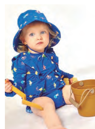
Campanha de moda