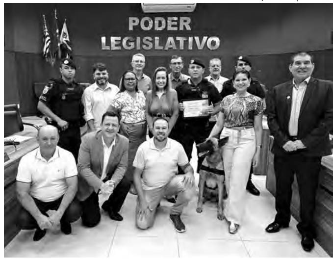
CANIL DA GCM. Foi destaque numa competição realizada no mês passado, ficando entre os melhores