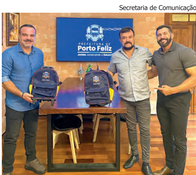
Secretaria de Comunicação

Ela fica perto de uma escola municipal de ensino infantil e também é vizinha de um pasto, por onde a equipe de atendimento ao público corre quando chega a GCM | Página 3