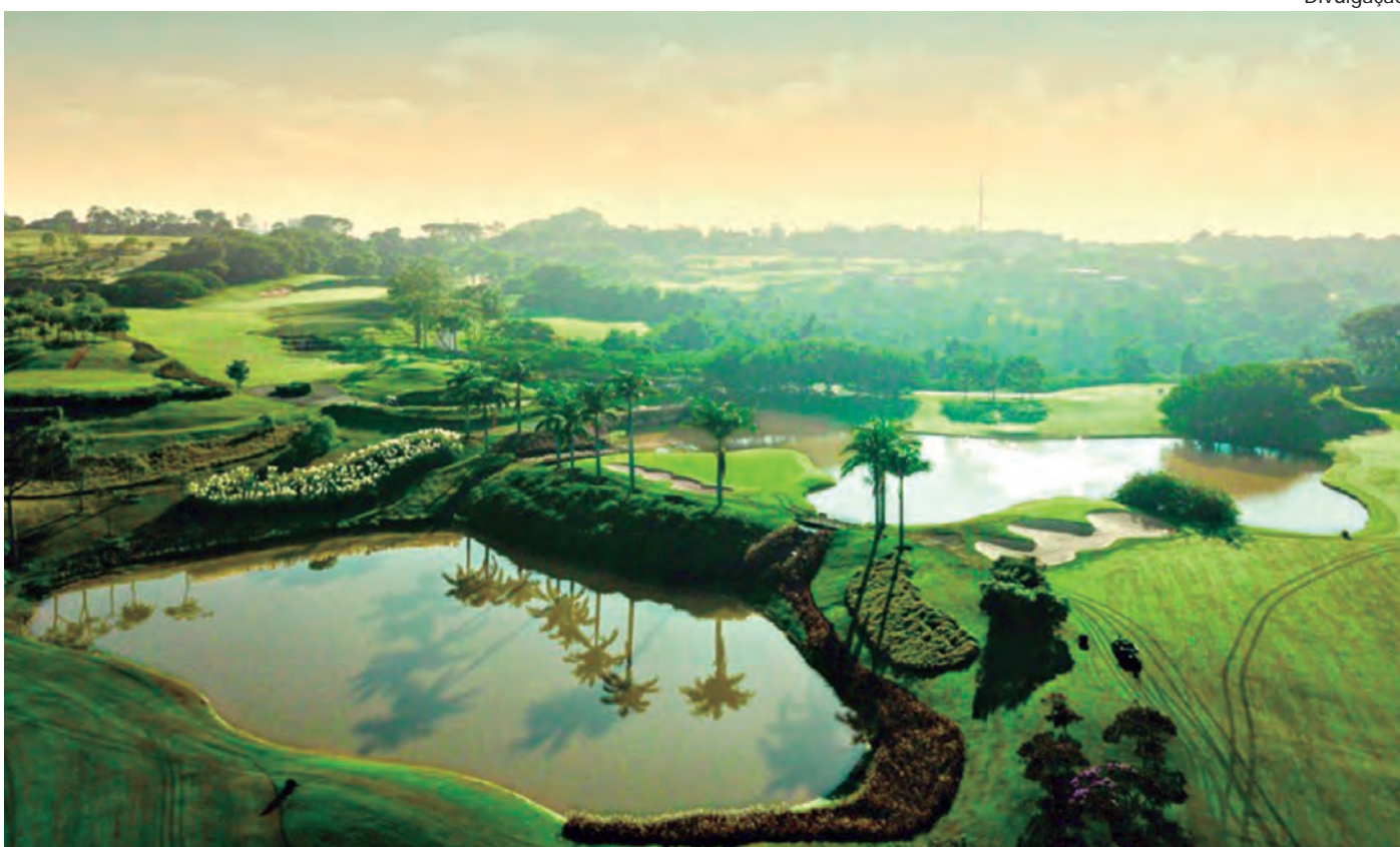
NOVO ESTUDO. A empresa vai implantar medidas para melhorar a gestão ambiental de todo o empreendimento

acesso não licenciadas e intervenção em cursos d'água. A juíza de Direito da 2ª Vara da Comarca, Raísa Alcântara Cruvinel Schneider, concedeu a liminar pedida e, em abril de 2024, mandou a empresa cessar de imediato qualquer obra ou venda de imóveis. Um mês depois, o Tribunal de Justiça do Estado suspendeu a liminar. O processo, porém, prosseguia. Com a assinatura do Termo de Ajuste de Conduta, a Ação Civil Pública é encerrada.