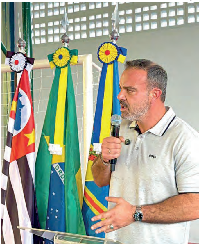
Secretaria de Comunicação

é dar 200% para cada aluno, garantindo que eles possam ser o que quiserem. “O futuro de Porto Feliz não está em nenhuma obra pública que nós fazemos, nem essa reforma. O futuro de Porto Feliz está dentro das salas de aula, dentro da escola pública municipal”, disse. O prefeito também anunciou o pioneirismo de Porto Feliz no Estado de São Paulo ao implementar a metodologia bilíngue na rede pública municipal nos anos iniciais, um programa que hoje só existe na rede privada. Além disso, citou o programa de intercâmbio estudantil gratuito, o “Porto Feliz Para o Mundo”, que leva alunos e professores para a Inglaterra, e a construção da maior escola de qualificação profissional da história da cidade, o Centro de Novas Oportunidades e Qualificação Profissional. Célio concluiu afirmando que o maior legado que a administração busca deixar é o de uma educação de qualidade e a criação de oportunidades para tirar a população da linha da pobreza através do ensino. E na tarde desta sexta, foi entregue a ampliação