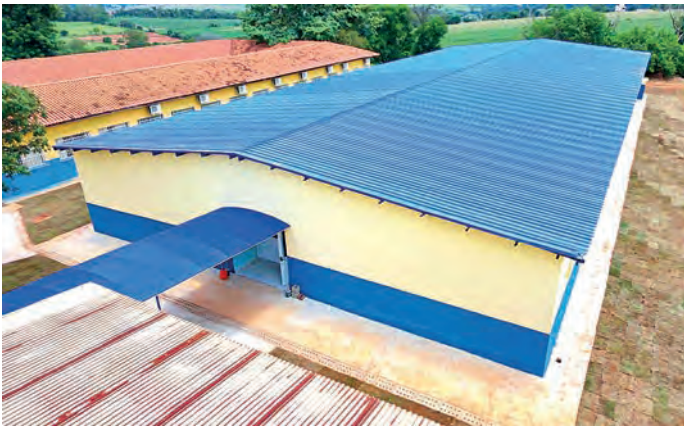
NO BOM RETIRO. Seis novas salas de aula