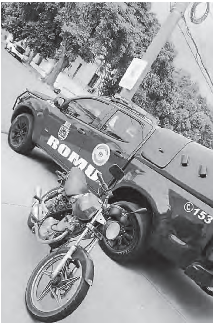
OCORRÊNCIA NA RUA RAPOSO TAVARES. A moto apreendida, a bolsa no telhado e as porções de cocaína