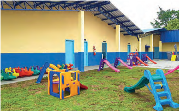
CEIM PEDRO MOREAU. Reforma completa