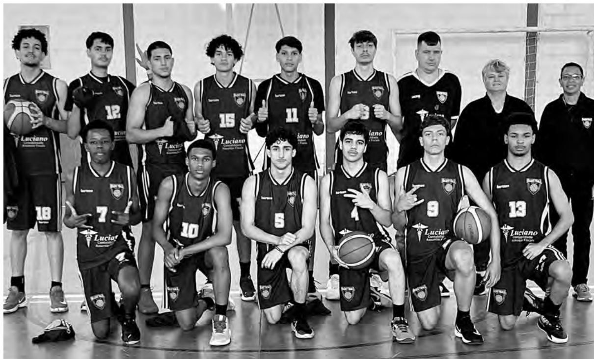
Secretaria de Comunicação

Com o resultado, a equipe segue firme na disputa e demonstra a força do trabalho de base do esporte porto-felicense, que vem se consolidando a cada rodada da Liga Desportiva.