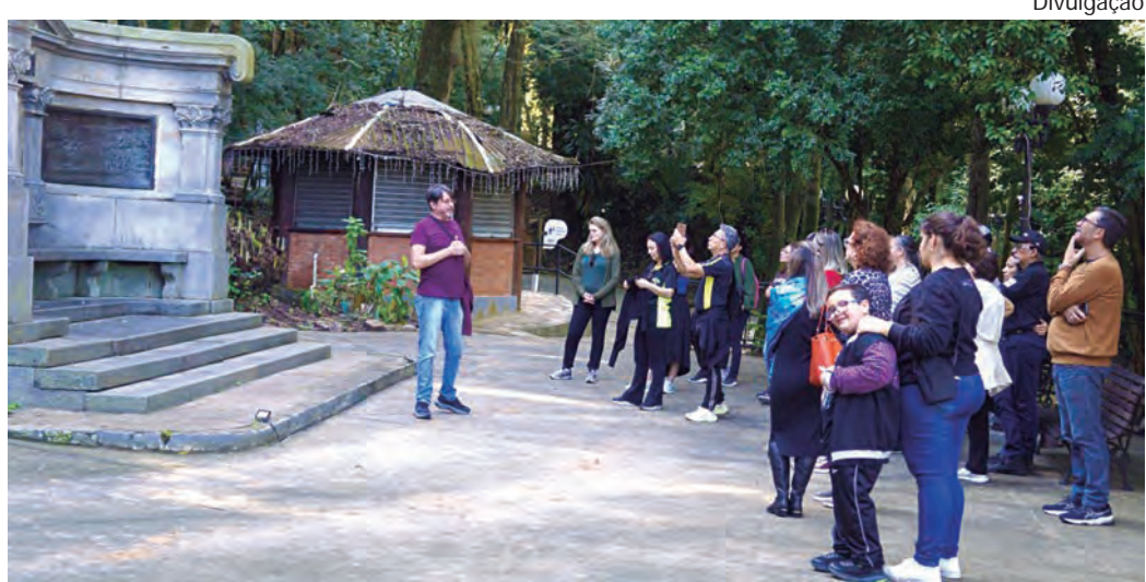
PARQUE DAS MONÇÕES. O passado porto-felicense desperta interesse na região

Vinte e seis participantes se inscreveram para o passeio, dentre professores e pessoas interessadas. Participaram, além de porto-feliceses, pessoas das cidades de Boituva, São Paulo, Sorocaba, Itu e Salto, o que demonstra o interesse que desperta a história da cidade de Porto Feliz.