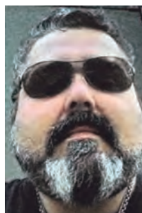
Na terça-feira 8 aniversária Fidel