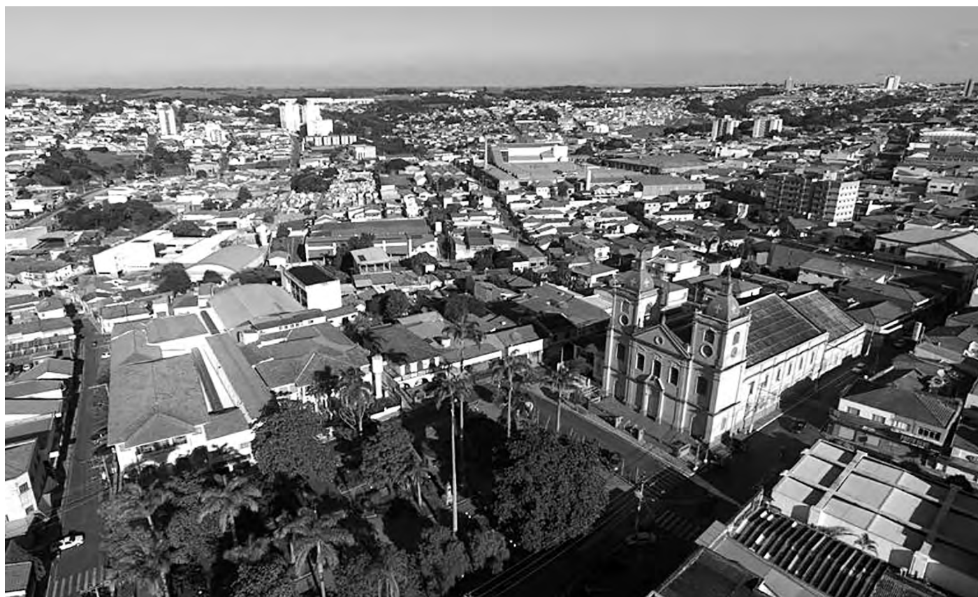
PORTO FELIZ VISTA DE CIMA. A cidade ofereceu ao Brasil, especialmente a São Paulo, personagens de grande valor no sertanismo; nas letras jurídicas, literárias e históricas; no jornalismo; na política; na medicina; na diplomacia; na administração e em outros setores da vida pública