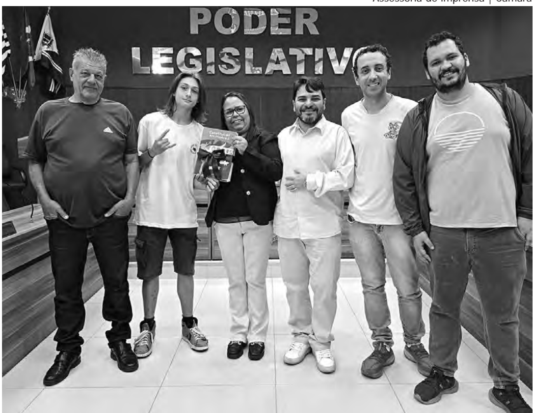
Assessoria de imprensa | Câmara

Após as explanações, três alunos foram premiados. Dois estudantes ganharam um exemplar da Lei Orgânica do Município e do Regimento Interno da Câmara por responderem corretamente a um questionamento realizado pelo Diretor da ELEP. E um aluno ganhou a Cole-