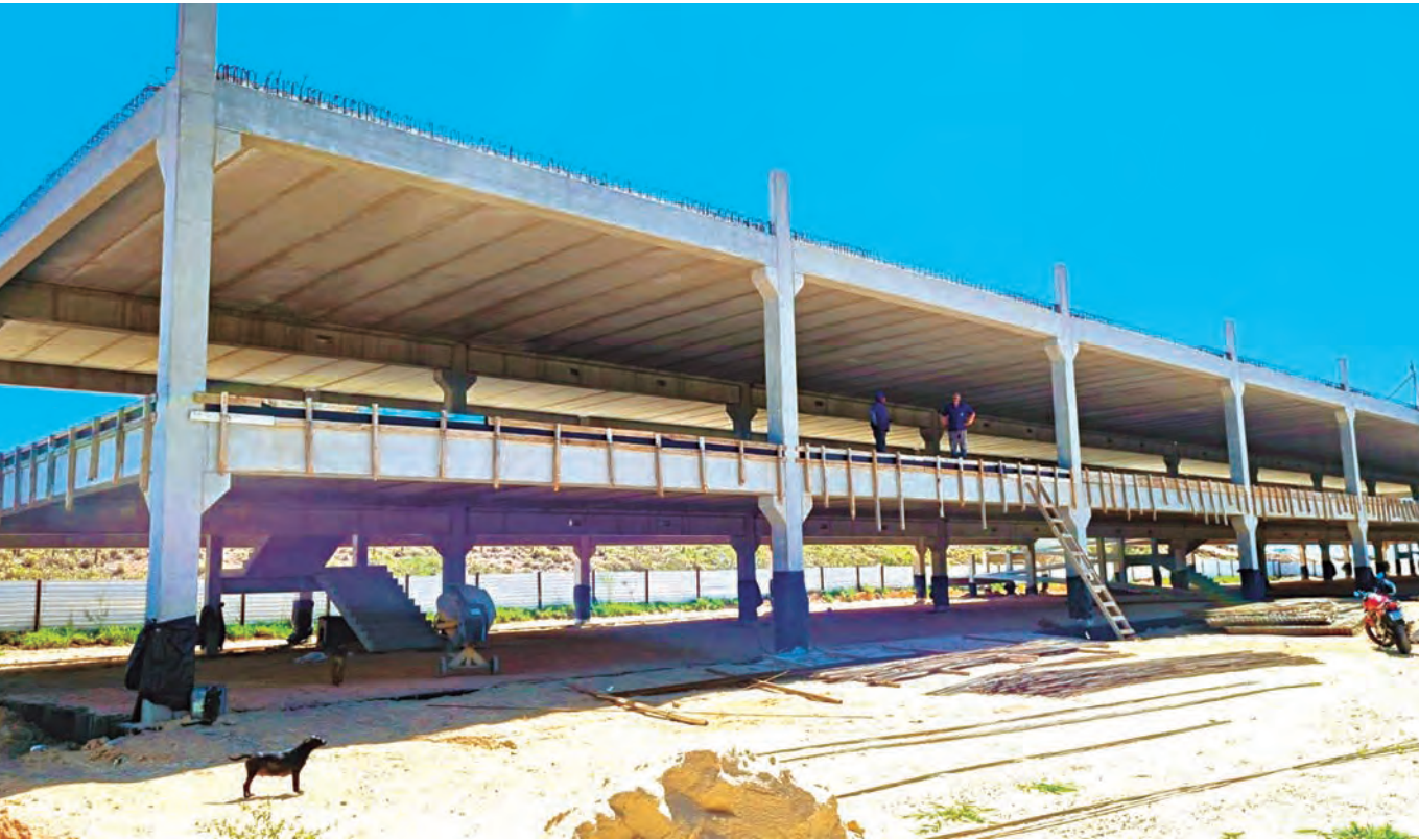
PRÉDIO IMPONENTE. A maior escola já construída pela Prefeitura já pode ser vista de longe