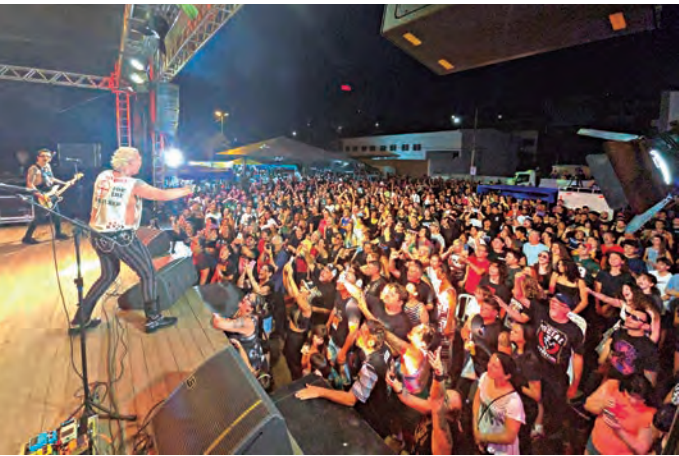
SUPLA. Público foi à loucura com o show de domingo

O Culturando Rock Festival encerrou sua edição 2025 reafirmando seu papel cultural na região e colocando o festival como um dos principais do interior paulista. O público vibrou intensamente durante todo o evento, que reuniu famílias, apaixonados por música e visitantes de várias cidades em um ambiente acolhedor, seguro e cheio de solidariedade.