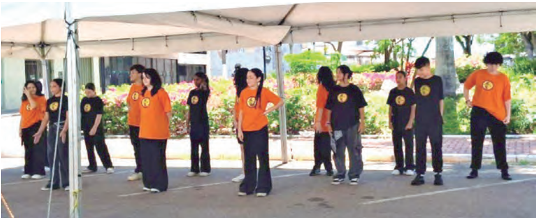
APRESENTAÇÕES. Artistas e grupos foram voluntários no evento da Biblioteca

O evento busca estimular a leitura, a imaginação e a sensibilidade do público