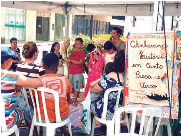
NOVIDADE. A 3ª Edição da Feira de Doação de Livros teve também apresentações artísticas

A manhã do último sábado (25) foi marcada por cultura, troca de conhecimento e incentivo à leitura, com excelente participação do público, reforçando a importância do acesso à literatura. A Prefeitura, por meio da Secretaria de Cultura, Esportes e Turismo, realizou a 3ª Feira de Doação de Livro na Biblioteca Pública Municipal Dr. Cesário Motta Junior.