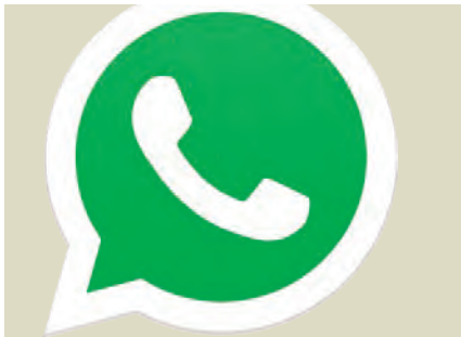
Mande sua foto por WhatsApp (15) 9.9805-97 40