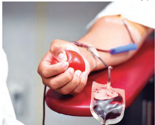
RESERVE A DATA. O mutirão acontece dia 26 na sede do Acreditar no Jardim Belo Alto

No próximo dia 26 (um sábado), será realizado um mutirão de doação de sangue. O mutirão está sendo organizado pela Prefeitura e Associação Acreditar em prol do Hospital Amaral Carvalho — o Hospital do Câncer de Jaú.