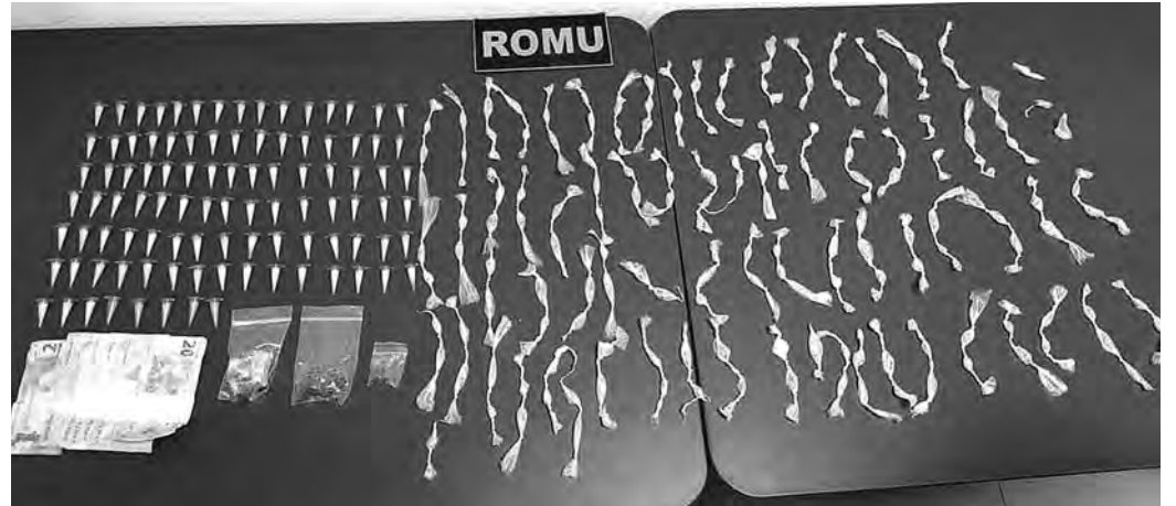
RAÇÃO QUE PASSARINHO NÃO COME. Suspeito diz começou no tráfico em dezembro