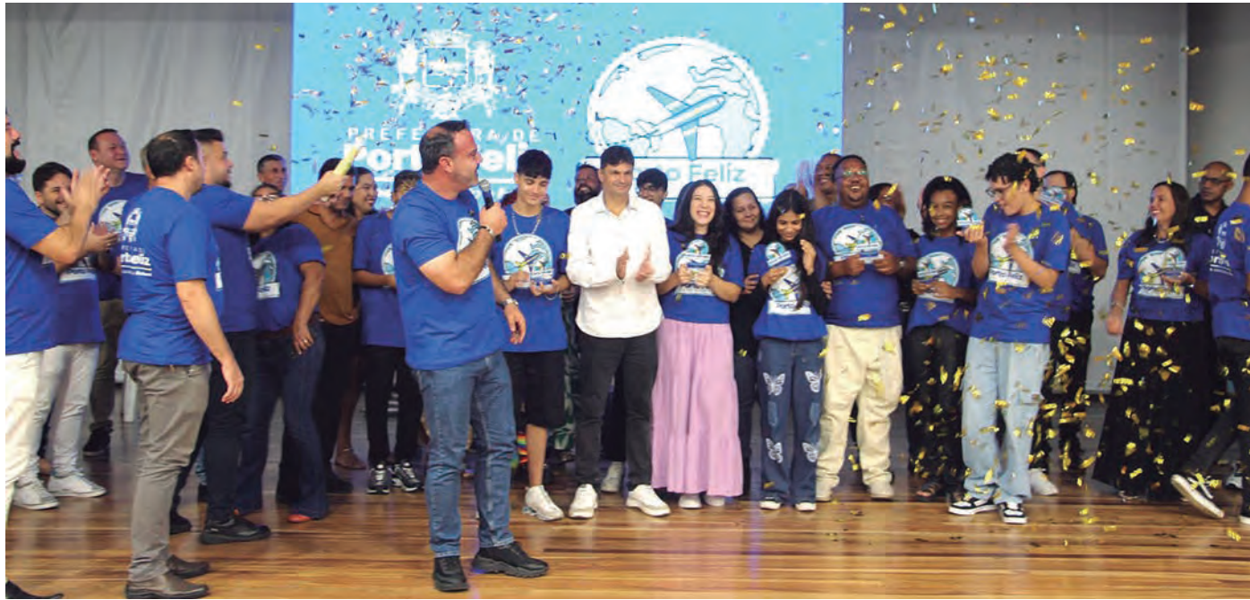
A TURMA PIONEIRA. Porto Feliz é a 2ª cidade no País a criar seu próprio programa de intercâmbio internacional

Em julho, eles vão viver uma experiência inédita