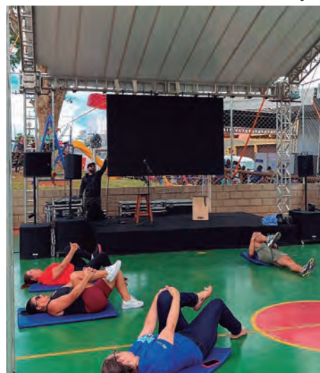
PRESTANDO SERVIÇOS. As equipes da Prefeitura atenderam muitos moradores da Vila América e região