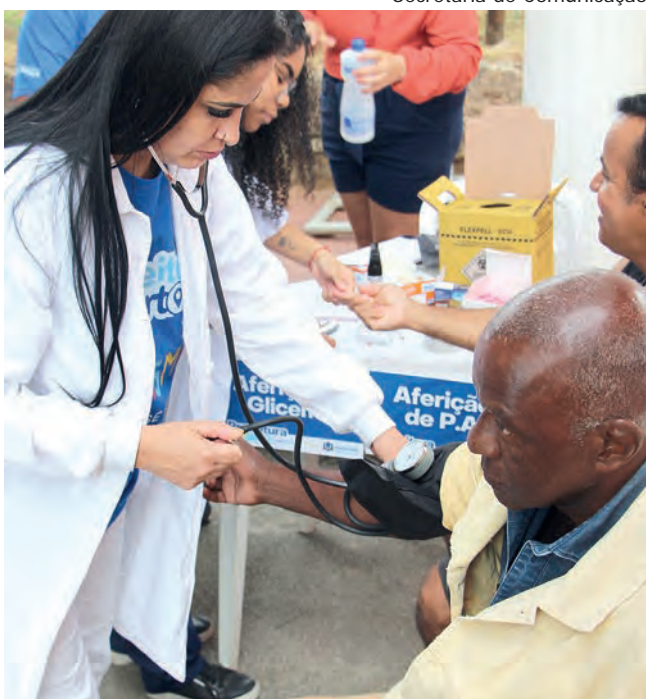
PRESTANDO SERVIÇOS. O projeto Prefeitura Mais Perto teve uma nova edição | Página 4