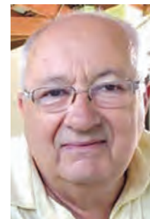
Na terça-feira 15 aniversária João