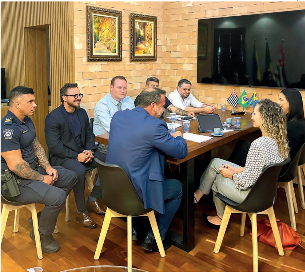
PARCERIA. Reunião na Prefeitura deu os toques finais à iniciativa