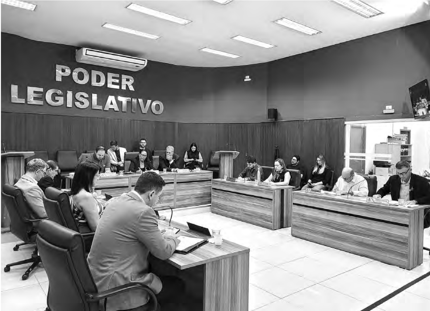
ELOGIOS. Contratação da Casa de Apoio em Jaú e duplicação da rodovia Dr. Antônio Pires de Almeida foram alguns dos temas discutidos na sessão ordinária desta segunda-feira