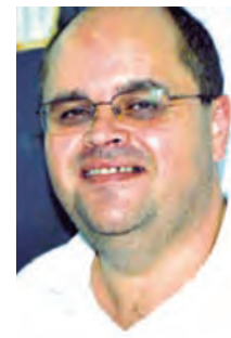
No domingo 13 aniversária Getúlio