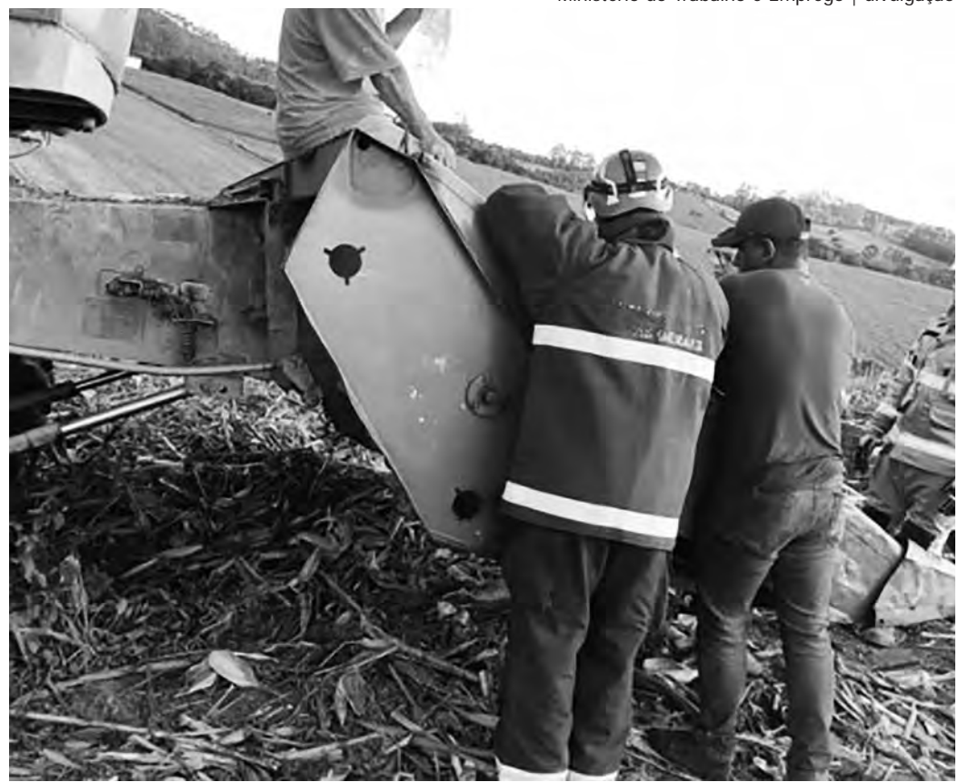
MÁQUINA PERIGOSA. Moinhos como o da foto têm causado muitos acidentes na região, segundo o Ministério do Trabalho e Emprego

O chefe regional da Fiscalização do Ministério do