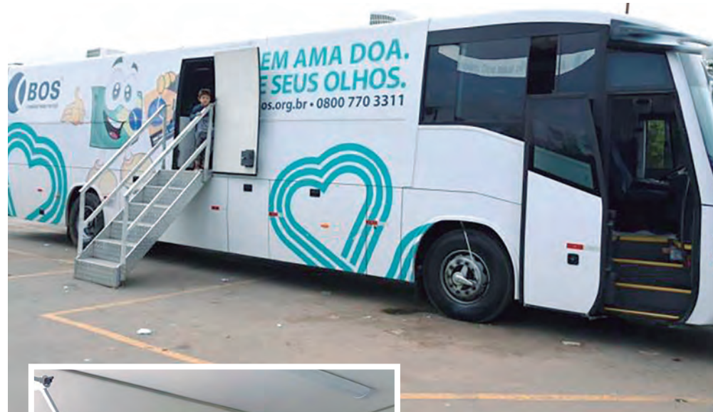
Secretaria de Comunicação