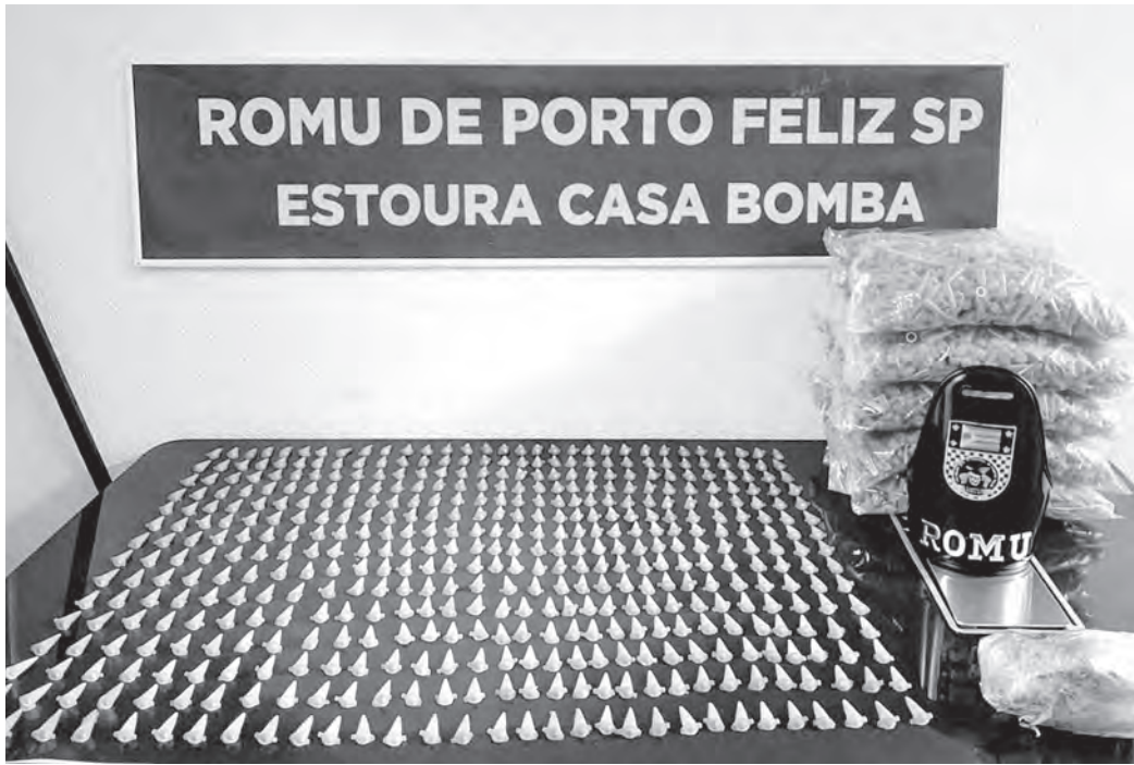
CASA BOMBA. Imóvel desocupado era usado como depósito das drogas