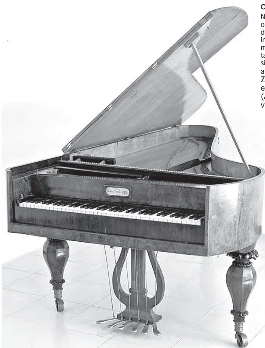
O 1º PIANO.

Conforme se observa, a condução de um piano para qualquer lugar do interior da Província de São Paulo, naqueles tempos antigos, não era uma questão simples, tal a dificuldade dos meios de transporte. Por essa razão a chegada do piano à Vila de Porto Feliz — o primeiro da Província de São Paulo —, no dia 2 de maio de 1820, foi um momento solene e de