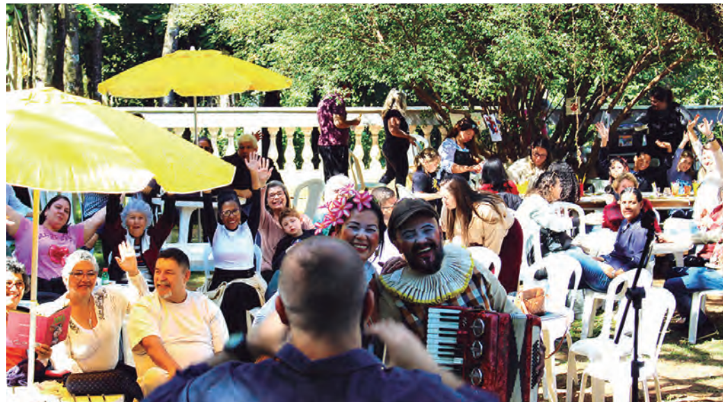
NA BIBLIOTECA. Haverá muitas outras atrações, como música, artesanato e comida