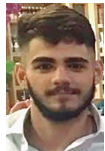
Na segunda-feira 20 aniversária Fernando