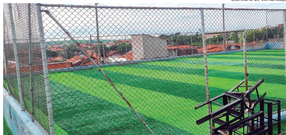
Secretaria de Comunicação

MAIS ESPORTE. A cidade está ganhando um novo espaço esportivo. A Prefeitura está construindo uma quadra no Residencial Bepim. Nesta semana foram instaladas as ferragens para fixação de alambrados. Num bairro vizinho, o Belo Alto, o espaço esportivo está em fase final e os moradores vão ganhar um campo de futebol society (foto).