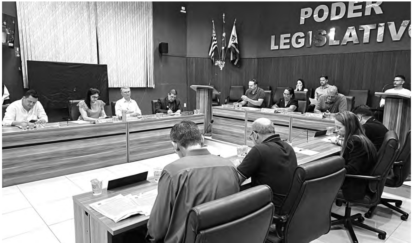
SESSÃO SORTIDA. A pauta desta semana foi variada e incluiu a criação de homenagem anual à imigração italiana

Diniz também comemorou a liberação da vacina contra o vírus respiratório (VSR) para gestantes a partir da 28ª semana em Porto Feliz.