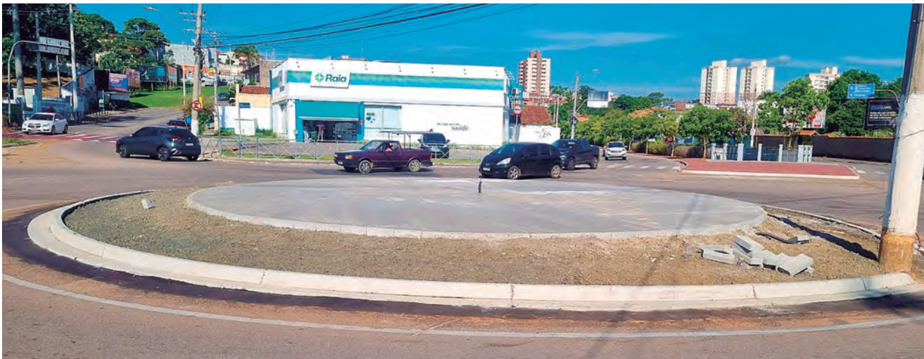
Secretaria de Comunicação

Dois homens estavam no local, se assustaram e fugiram correndo pelos fundos, deixando para trás quase 500 porções de cocaína, meio quilo de maconha e pinos vazios | Página 3