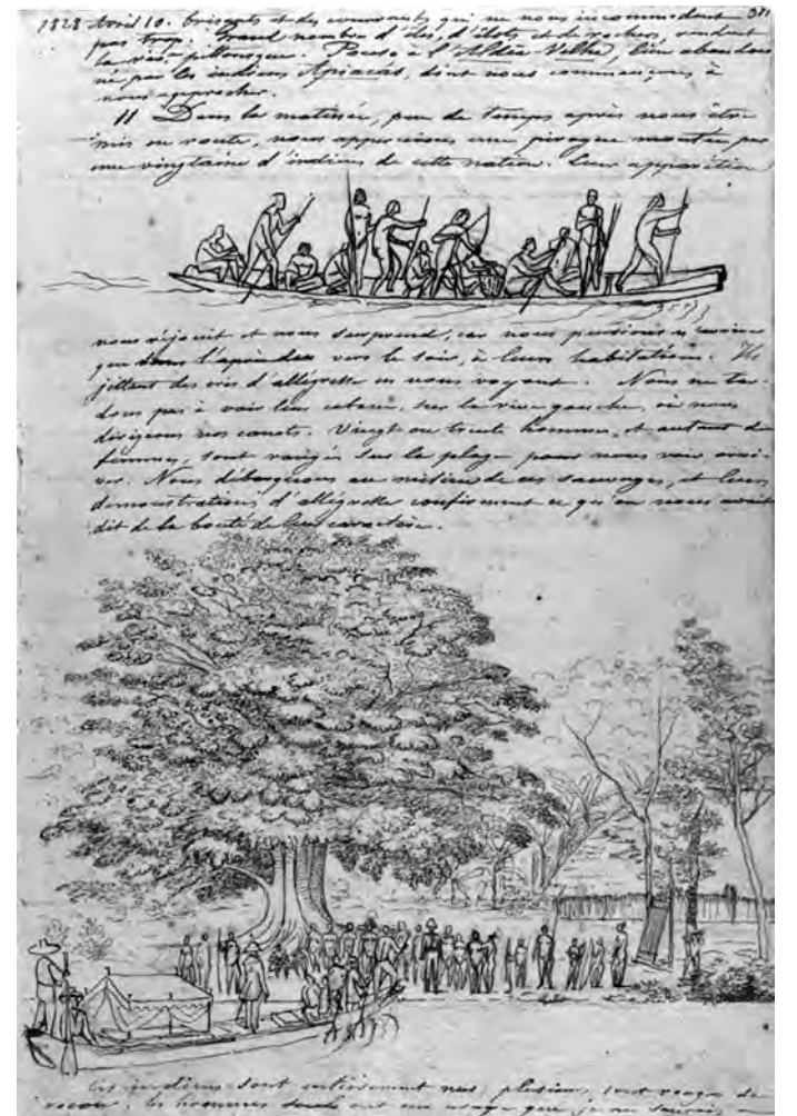
ENCONTRO COM O POVO APIAKÁ. Página 371 do manuscrito L'Ami des Arts (1837-1859); grafite e tinta metálica sobre papel

e de nos questionarmos quanto ao futuro que estamos construindo.”