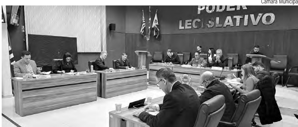
PRIMEIRA SESSÃO DO MÊS. Foi marcada por homenagens e discursos

No Tema Livre, vereadores falaram sobre conquistas