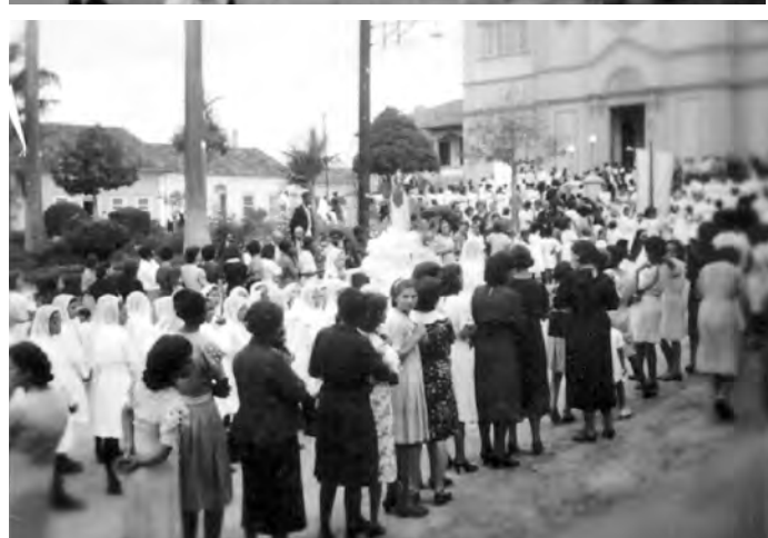
EM 1938. Fiéis celebram São Benedito