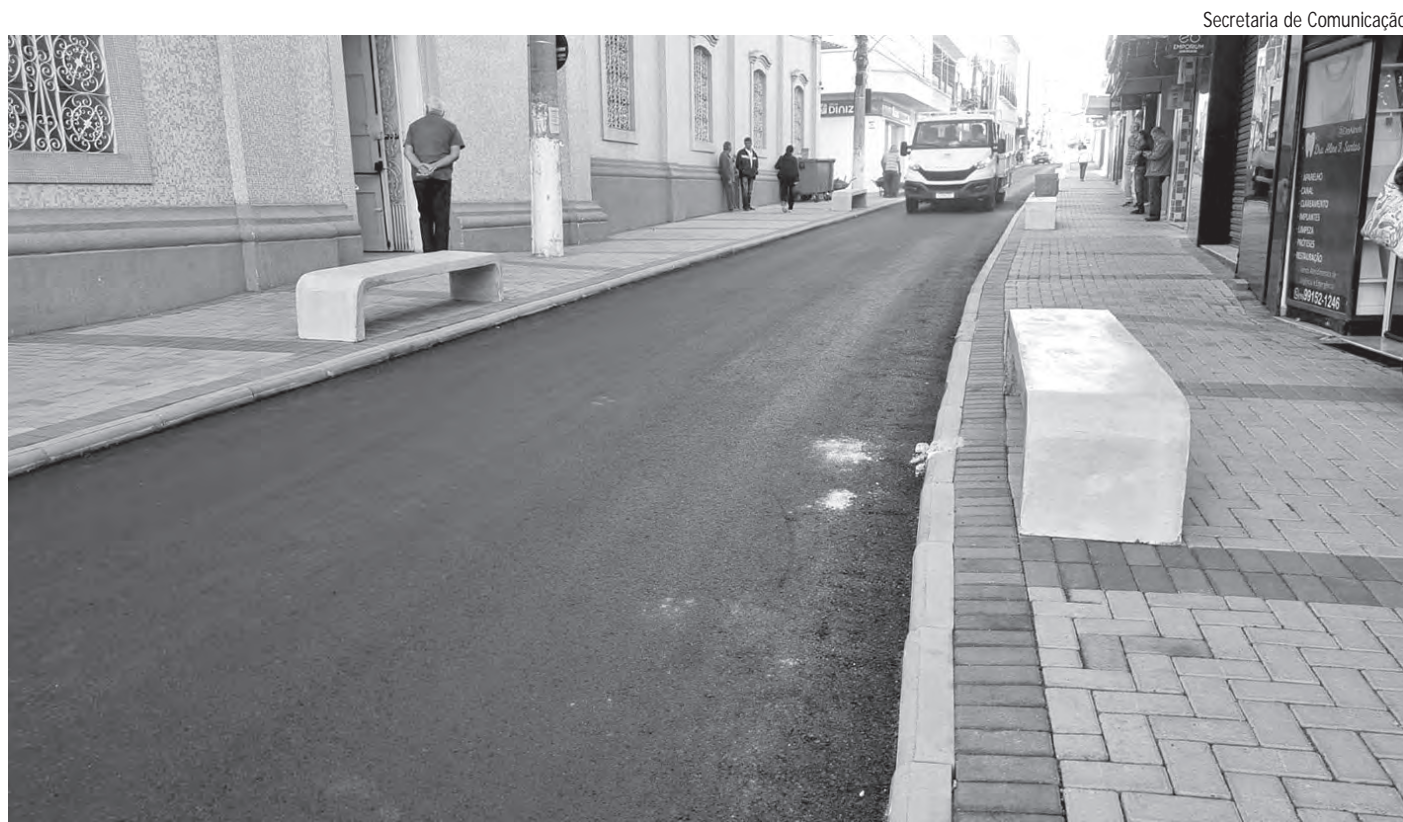
Secretaria de Comunicação

O Maio Laranja faz referência ao Dia Nacional de Combate ao Abuso e à Exploração Sexual de Crianças e Adolescentes, lembrado em 18 de maio em todo o País.