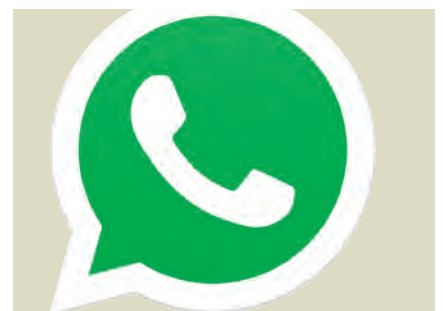
Mande sua foto por WhatsApp (15) 9.9888-18 14