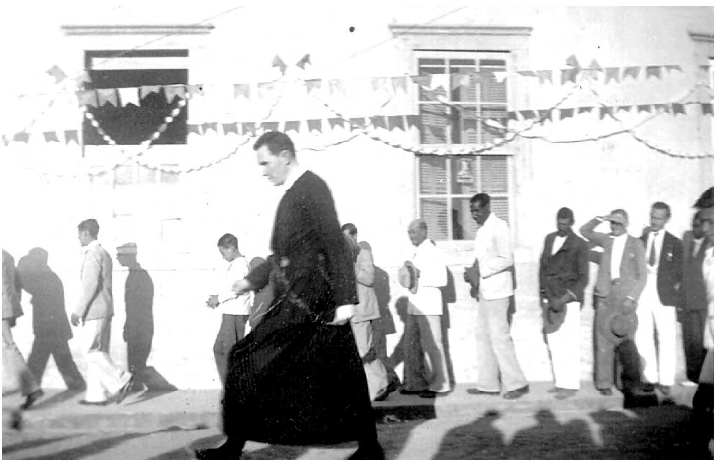
EM 1934. Curiosa foto do acervo de Vasco Coli mostra um religioso, apressado, durante uma procissão