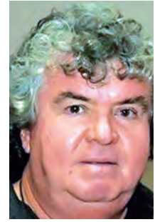
Na quarta-feira 10 aniversária Carlos