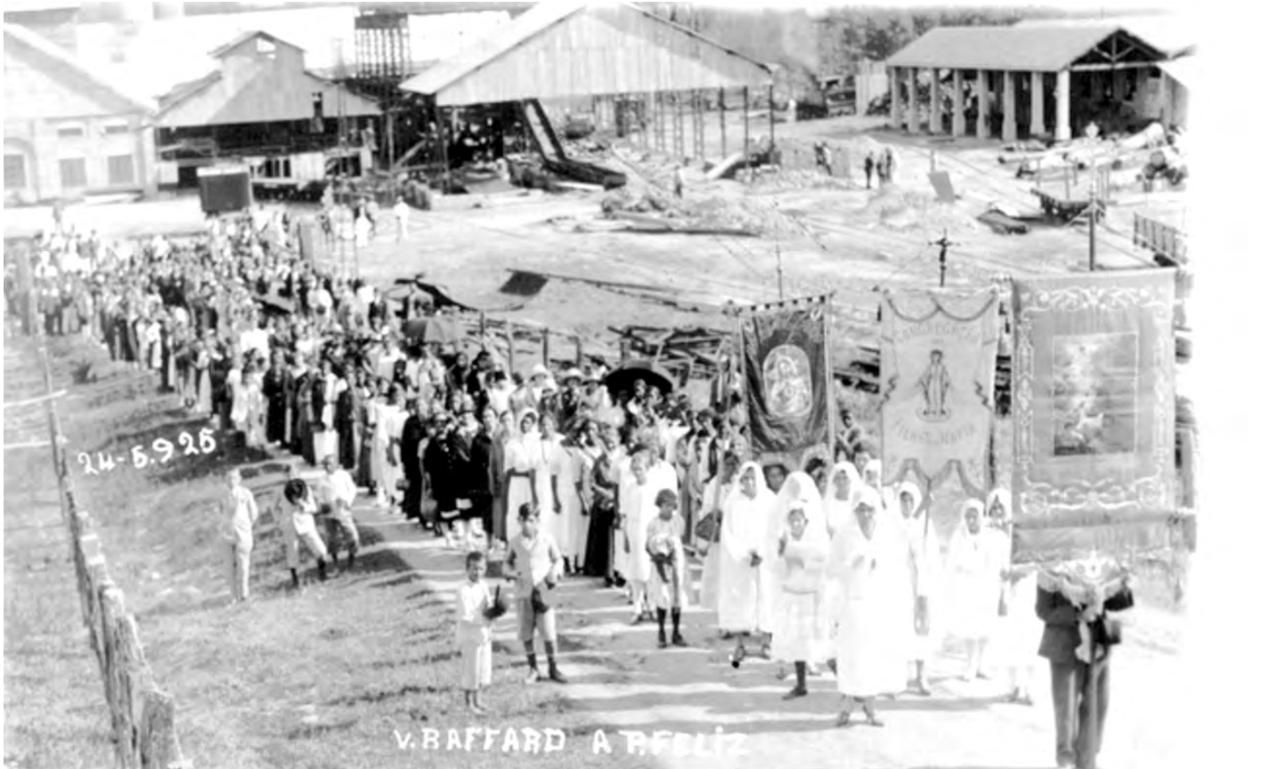
MAIO DE 1925. Procissão entre Rafard e Porto Feliz passa pelo Engenho Central