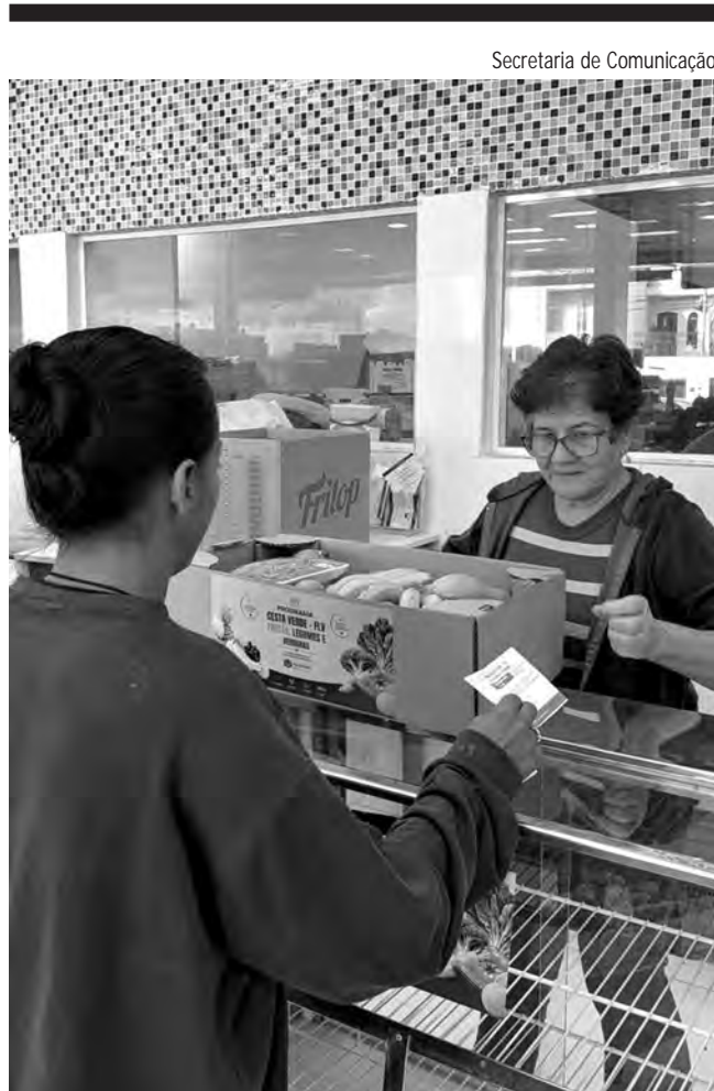
Secretaria de Comunicação

câmeras de monitoramento nos quartos dos residentes de forma indiscriminada. Em fevereiro do ano passado a 1ª Vara da Comarca atendeu a pedido da promotora e concedeu liminar obrigando a Cidade dos Velinhos a adotar uma série de medidas voltadas a garantir direitos aos moradores. A entidade teve de permitir visitas dos familiares em horários flexíveis, com duração mínima de duas horas diárias. Também teve de permitir aos idosos o uso de celulares, proibindo acesso ao aparelho apenas em casos que envolvam impossibilidade ou risco. O uso de câmeras de monitoramento foi reduzido.