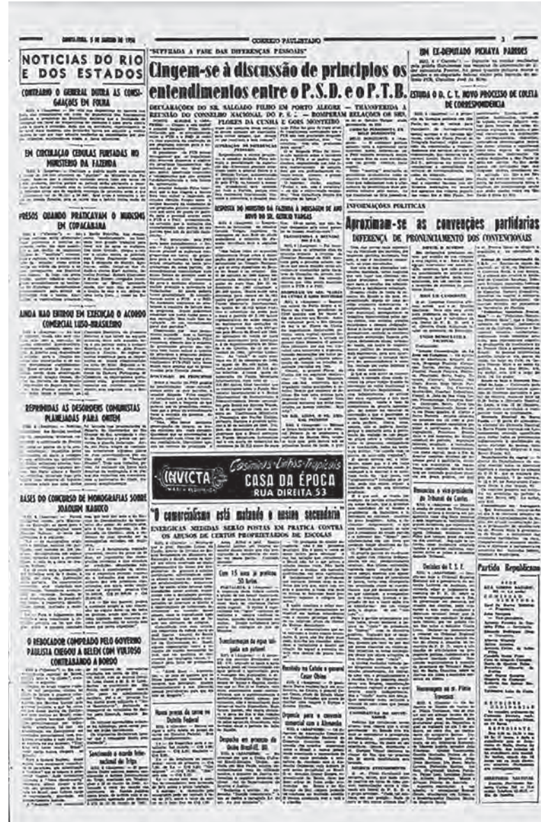
Hemeroteca da Biblioteca Nacional

Em janeiro do mesmo ano, durante as convenções partidárias, Prestes Maia já havia se reunido com diretores da 6ª Zona em Campinas, em que estiveram presentes os udenistas e os partidários do Partido Republicano Paulista (PRP) de Porto Feliz, para um “grandioso comício em praça pública, no qual o sr. Prestes Maia se dirigirá à população e ao operariado da