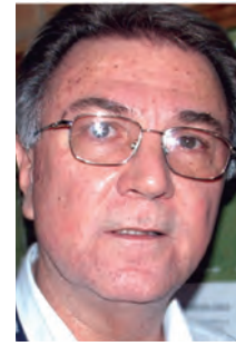
Na terça-feira 9 aniversária Crocco