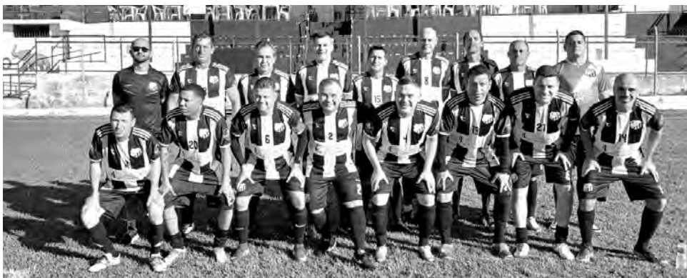
CINQUENTÃO ALVINEGRO. Perdeu a invencibilidade para o Imperial