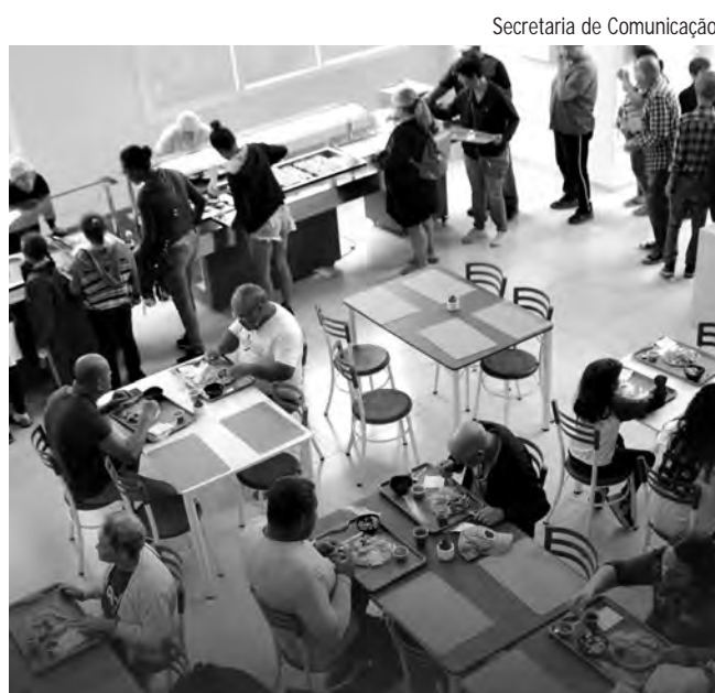
Secretaria de Comunicação

Além de garantir maior acesso a frutas, legumes e verduras, a ação incentiva o consumo de alimentos naturais, promovendo mais saúde, prevenção de doenças e melhores condições nutricionais para crianças, adultos e idosos.