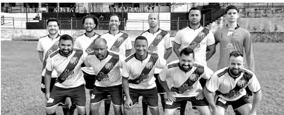
MÁSTER. Foi a única equipe do Ararita a vencer neste final de semana