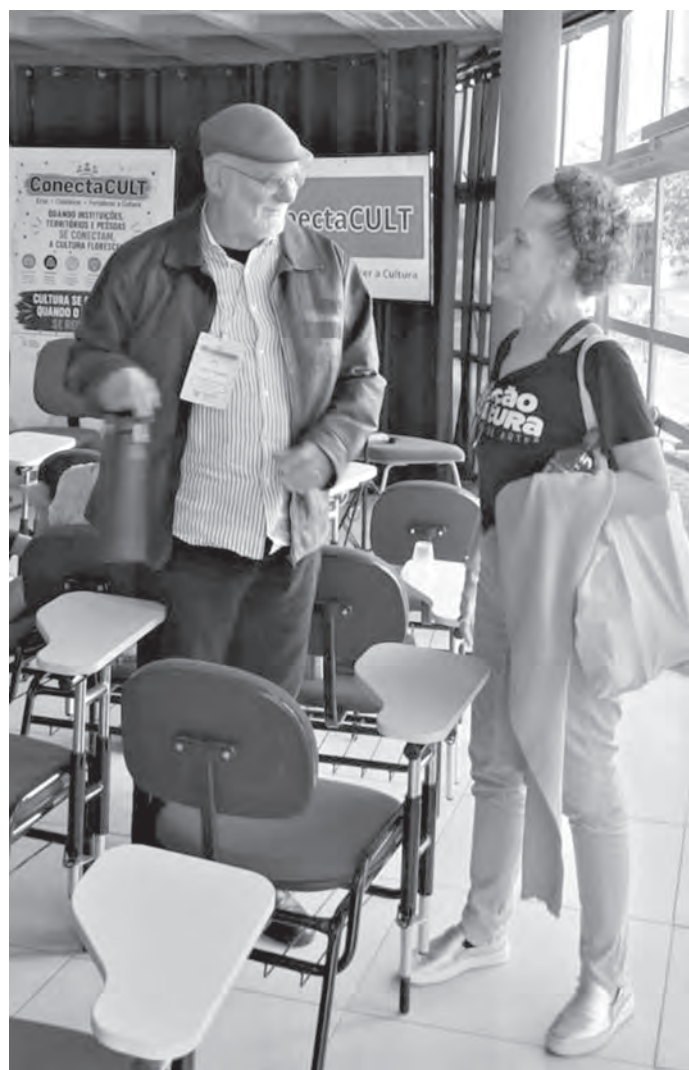
CÉLIO TORINO. O historiador, escritor e agente cultural fez uma palestra; ele é o idealizador dos Pontos de Cultura, que tornou-se referência nacional