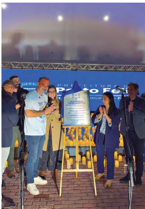
PLACA. A cidade ganha um novo parque