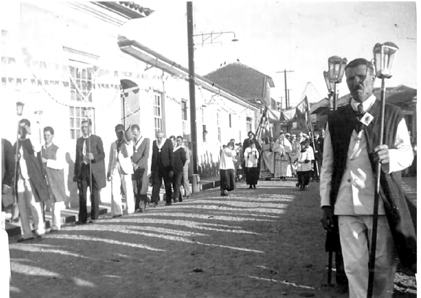
PROCISSÃO DE CORPUS CHRISTI EM 1938. Os fiéis passam pela Rua Bandeirantes