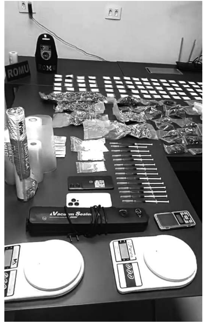
CLIENTES DE FINO TRATO. Nesta apreensão a ROMU encontrou muitas drogas sintéticas, como ecstasy e seringas com o princípio ativo da maconha, o THC

Os GCMs voltaram ao bloco 14 e, no segundo andar, surpreenderam