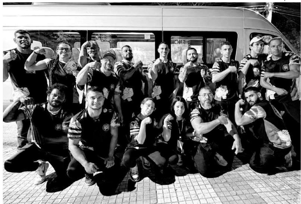
ENTRE OS MELHORES. Os porto-felicenses mediram força com equipes de todo o País num dos maiores eventos esportivos do mundo, o Arnold Sports Festival

A equipe de Luta de Braço de Porto Feliz fez bonito no Campeonato Brasileiro Arnold Sports Festival 2026. Um dos maiores eventos esportivos do mundo, o Arnold Sports Festival foi realizado de 24 a 26 de abril no Expo Center