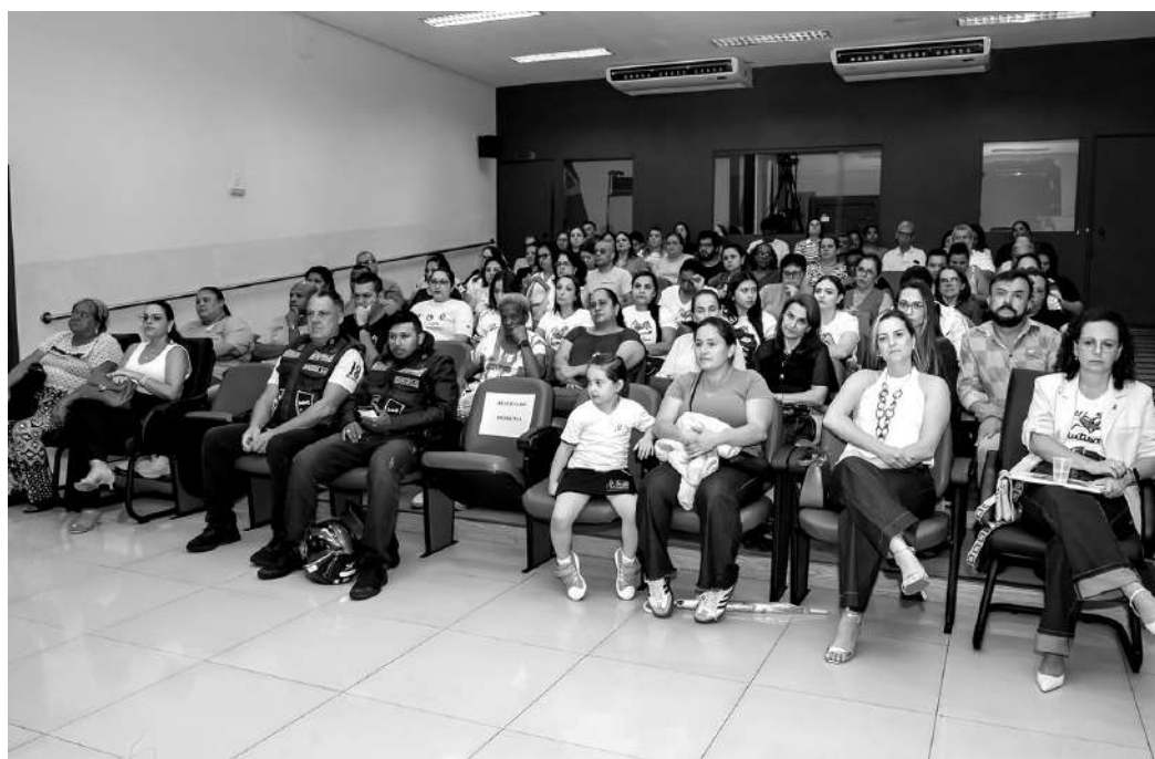
Um público numeroso participou do evento

Você não é terapeuta, não tem que se cobrar estimular o tempo todo. Põe ela no colo e vibra com as pequenas conquistas. O impossível é só na Disney. Aqui é vida real".