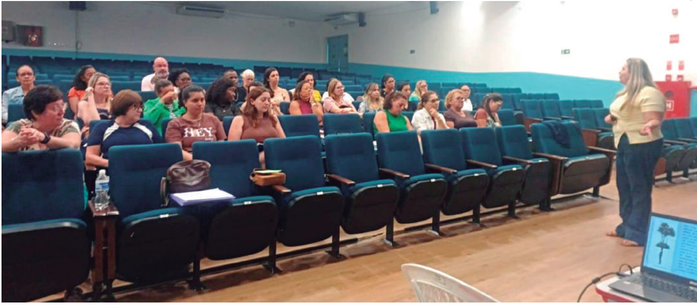
Secretaria de Educação

LEITURA E EDUCAÇÃO. Nesta quinta-feira (29) a Secretaria de Educação promoveu o 5º Encontro do LEEI — Leitura e Escrita na Educação Infantil. Gestores e professores