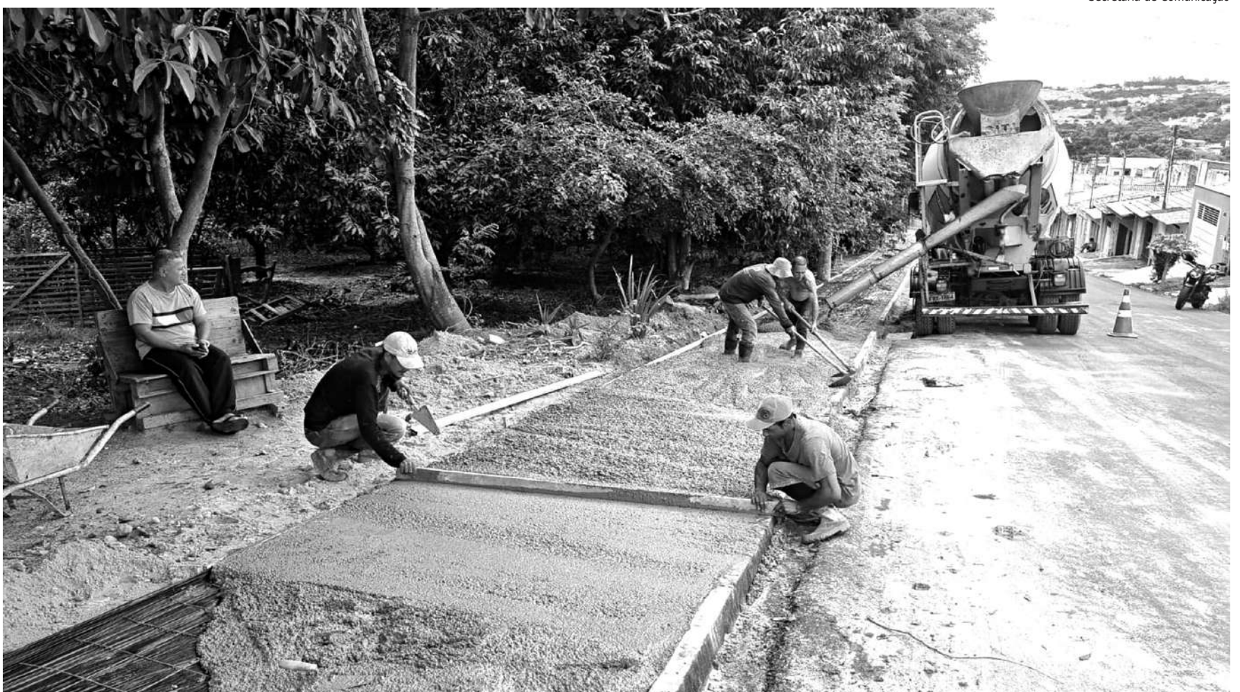
LUGAR DE PEDESTRE É NA CALÇADA. A Secretaria de Serviços Públicos está realizando os trabalhos de concretagem de calçadas em todas as áreas verdes do nosso município. Bairros como Santa Terezinha, Jardim Tendá, Terras do Porto, Jardim Vante e Jardim São José estão incluídas neste programa. O objetivo é melhorar a mobilidade e proporcionar maior segurança para os pedestres em todos os pontos da cidade.

CURSOS. O Fundo Social de Solidariedade de Porto Feliz está com inscrições abertas para cursos gratuitos de capacitação profissional. As vagas são limitadas e destinadas a moradores que desejam adquirir novas habilidades e ampliar as oportunidades de geração de renda. Entre as opções oferecidas estão os cursos de design de sobancelhas, “empreendendo com batatas”, preparo de marmitas, cozinha fria e confeitaria, áreas com grande demanda no mercado e que possibilitam atuação autônoma ou inserção no setor de serviços. As inscrições devem ser realizadas presencialmente no CEMIP/SENAI, de segunda a sexta-feira, das 8h às 17h30, na Rua Anita Garibaldi, no 500. A iniciativa tem como objetivo promover a qualificação profissional e incentivar o empreendedorismo local, contribuindo para o desenvolvimento social e econômico do município. Os interessados devem se inscrever o quanto antes para garantir uma das vagas disponíveis.