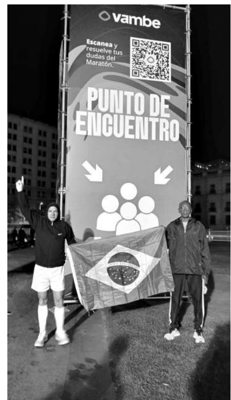
LARGADA. A prova teve início em frente ao Palácio de La Moneda