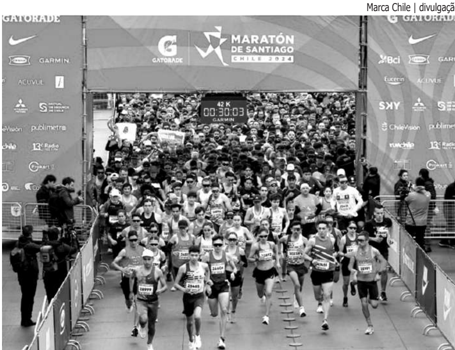
35 MIL CORREDORES. A prova teve desde atletas de elite até paratletas, vindos de 42 países para uma prova reconhecida World Athletics