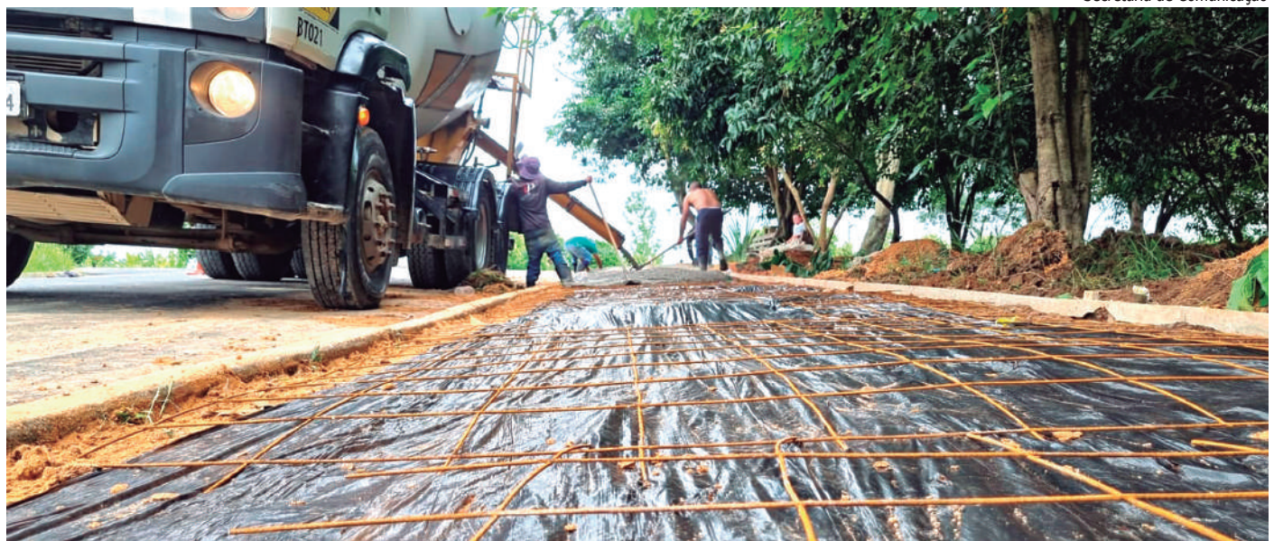
Secretaria de Comunicação

Porto Feliz está entre os 50 municípios que mais geraram empregos com carteira assinada no 1º bimestre | Página 4