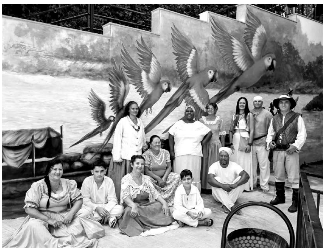
VALORIZANDO A MEMÓRIA. As apresentações ocorreram no dia em que o Parque das Monções foi inaugurado, 26 de abril, e encantaram e surpreenderam os visitantes