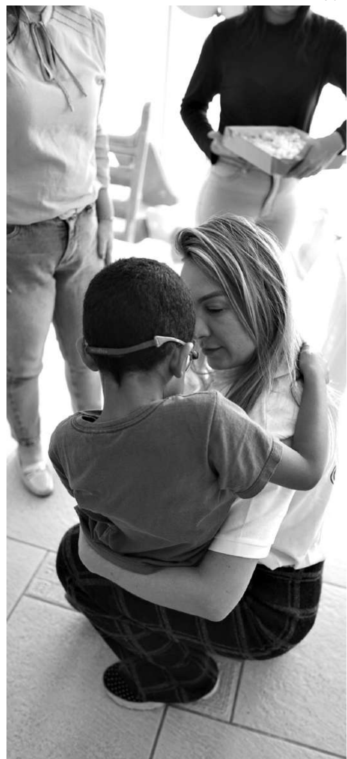
TRABALHO CONTÍNUO. O atendimento às crianças com TEA visa apoiar o desenvolvimento, fortalecer vínculos e ampliar possibilidades reais de inclusão