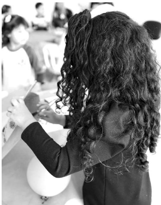
NO CIEM. Crianças de quatro e cinco anos recebem suporte educacional integrado

A atuação no município acompanha um cenário