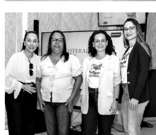
As palestrantes apresentaram reflexões profundas sobre o tema