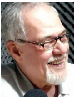
Na segunda-feira 4 aniversária Badu