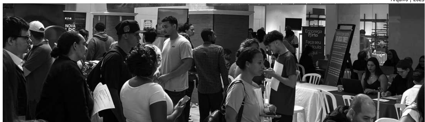
Arquivo | 2025

ABRINDO AS PORTAS. A Semana do Empreendedor oferece muitas oportunidades para todos os segmentos