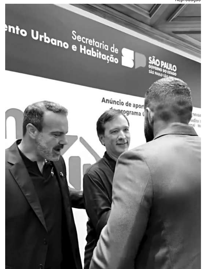
EM SÃO PAULO. O prefeito Célio e vice-prefeito Lucas cumprimentam o secretário de Estado da Habitação, Marcelo Branco

Porto Feliz já foi contemplada com 530 moradias a preço social, além de 150 casas da Companhia de Desenvolvimento Habitacional Urbano (CDHU). E, nesta semana, 67 famílias de menor renda foram beneficiadas com cartas de crédito