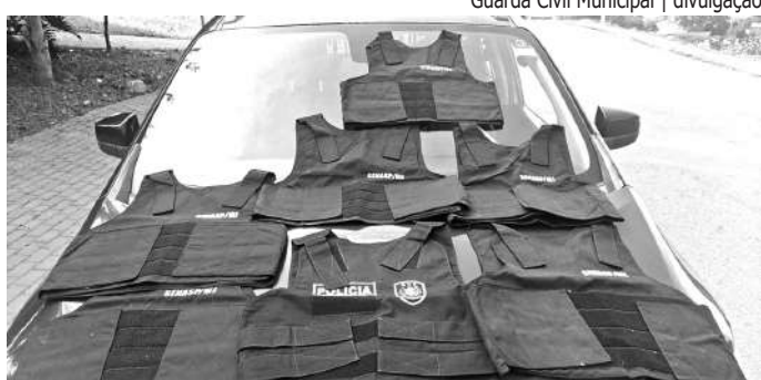
MALA SUSPEITA. Uma mala foi abandonada na Praça Odair Ferraz Oliveira — Di da Loteca (Vila Marteli). As 10h20 desta quinta-feira (29), uma equipe da Guarda Civil Municipal chegou ao local para verificar a mala suspeita. E bota suspeita nisso: em seu interior havia sete capas de coletes balísticos. Seis eram da Secretaria Nacional de Segurança Pública, um órgão do Ministério da Justiça e Segurança Pública, e uma da Polícia Civil de Pernambuco. O material foi apreendido e levado à Delegacia de Polícia Civil.