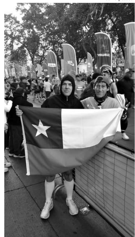
MANHÃ FRIA. O domingo começou com 13 graus em Santiago do Chile