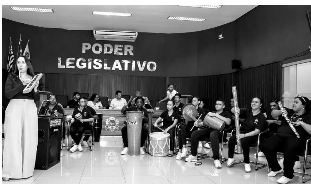
Banda Unidos da APAE